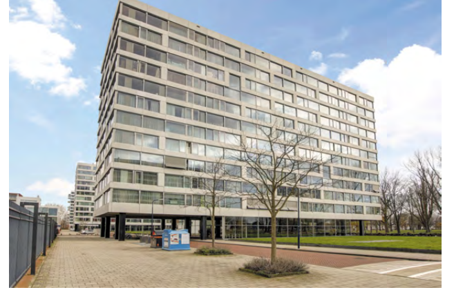
Jan van Zutphenstraat 609, Nieuw West Vraagprijs € 425.000,- KK