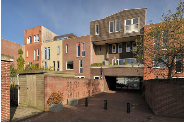
John Campbellstraat 8, IJburg Vraagprijs € 750.000,- KK