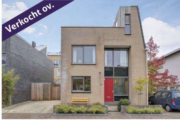
Pieter Holmstraat 20, IJburg Vraagprijs € 700.000,- KK