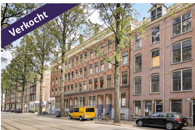
Czaar Peterstraat 170D, Oost vraagprijs € 355.000,- KK