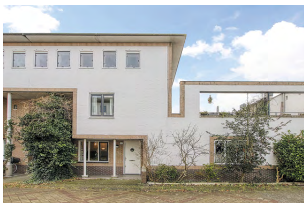
Rumbeke 5, Nieuw Sloten vraagprijs € 375.000,- KK