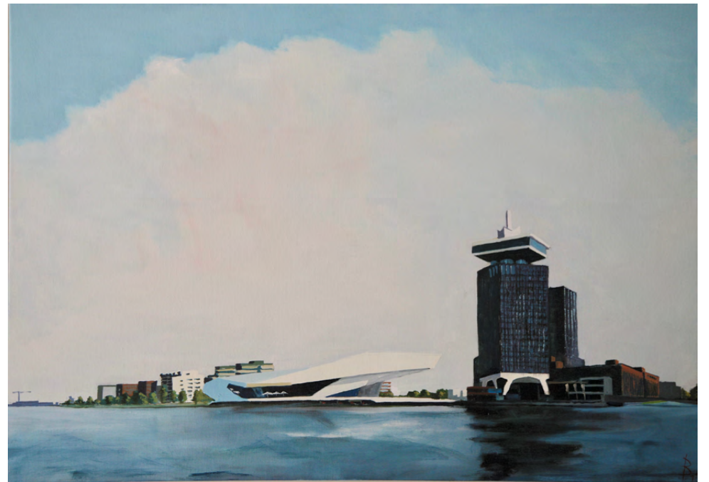
De nieuwe oprit. Tweeluit, olieverf, 200 x 70 cm.