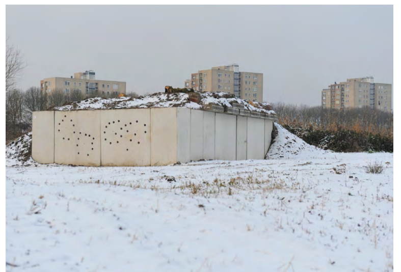
Het Diemerpark maakt deel uit van het Nationaal Natuurnetwerk, dat natuurgebieden met elkaar verbindt. De vleermuisbunker geeft verschillende beschermde diersoorten een steuntje in de rug.

De stadsecoloog benadrukt het belang van dit project: "We doen hiermee ook kennis op over natuurinclusief bouwen op IJburg 2. Het is goed om daar neststenen in te metselen en spleten open te laten voor vleermuizen. Misschien kunnen we ook iets voor ze doen onder bruggen, daar kijken we nog naar."