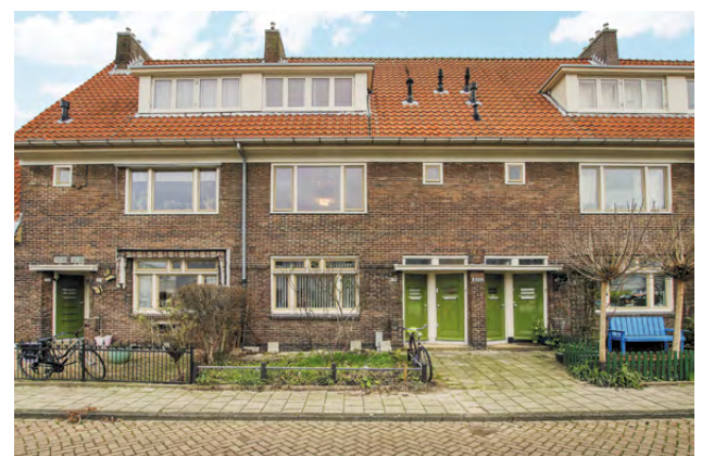
Ploegstraat 181, Oost vraagprijs € 399.000,- KK