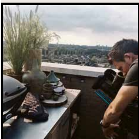
Achter de schermen bij Eigen Huis & Tuin.