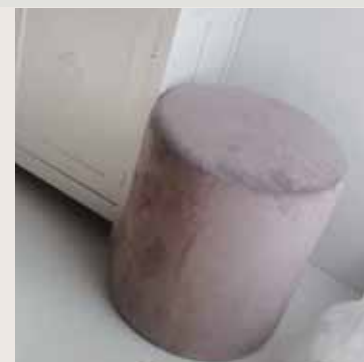
Een velours poef.

de poster met een motiverende quote door een van je eigen zwart-witfoto's in een mooie lijst. Bij voorkeur een zwarte, dat staat chiquer. En zoek meubels met een verhaal. Dat kan bijvoorbeeld een tweedehands rotanstoel zijn, een oude goudkleurige lampenvoet of een antiek kastje dat je kan schilderen of juist niet. Van Riek: 'Ik heb zo'n oude pauwstoel staan, die vond ik bij mijn tante op zolder. Grote interieuritems hoeven niet duur te zijn, door markten af te struinen of bij oma op de vliering te kijken kun je fantastische items vinden.' ●