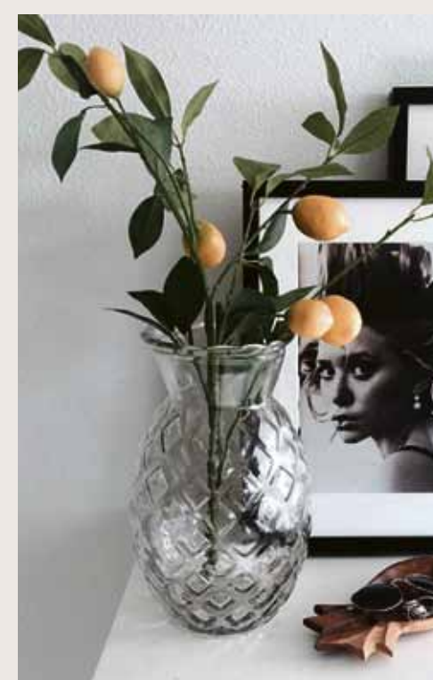
Citroenen zie je steeds vaker in het interieur sinds het album Lemonade van Beyoncé uitkwam.