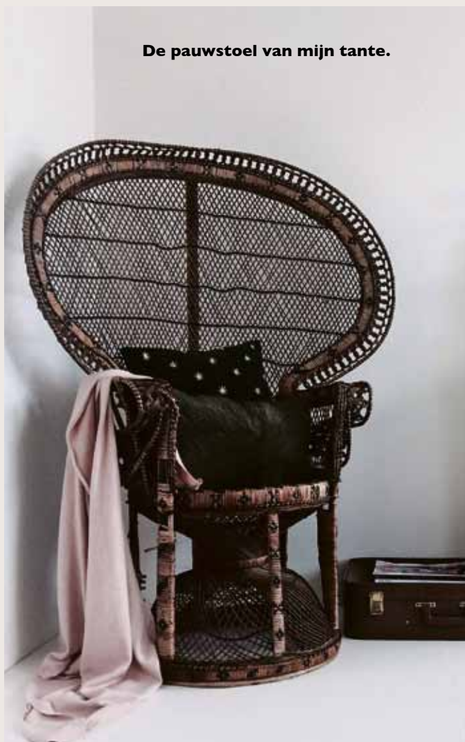
De pauwstoel van mijn tante.

Een goed interieur is persoonlijk. Als je het nog niet had gedaan, vervang dan