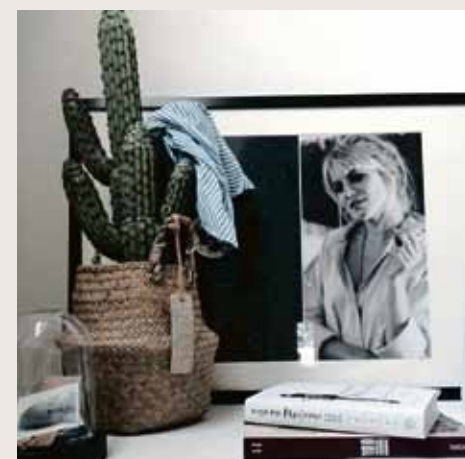
Cactussen groeperen hoeft niet meer, maak liever een statement met één grote cactus.