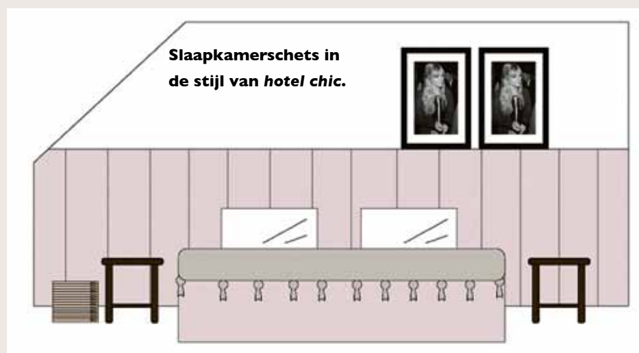
Slaapkamerschets in de stijl van hotel chic.