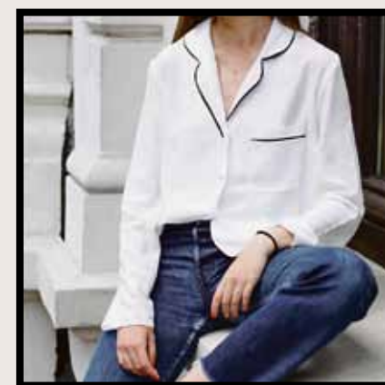
De pyjamas all day-trend.