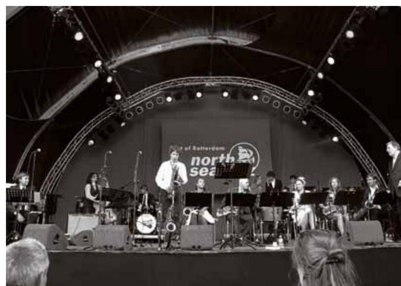
North Sea Jazz Festival 2014.

internationale podia. Zo speelde de Jazz Focus Big Band de afgelopen jaren op het North Sea Festival, het Grachtenfestival, in het Bimhuis en de Melkweg. Tijdens Jazz aan de Haven brengt de 16-koppige bigband een ode aan bekende 'Heroes of Jazz' met hun bewerkingen van sfeervolle ballads en energerende funk tot alles daar tussenin. Jazz aan de Haven, 7 april, 20.00 uur, Krijn Taconiskade 372, IJburg. Zie: cafe-ed.nl.