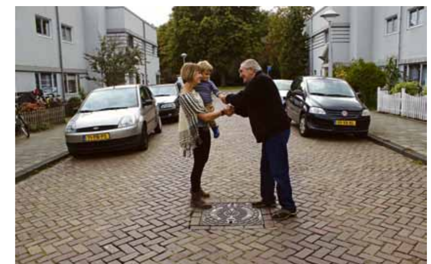
De veeteeltstraat, Betondorp.