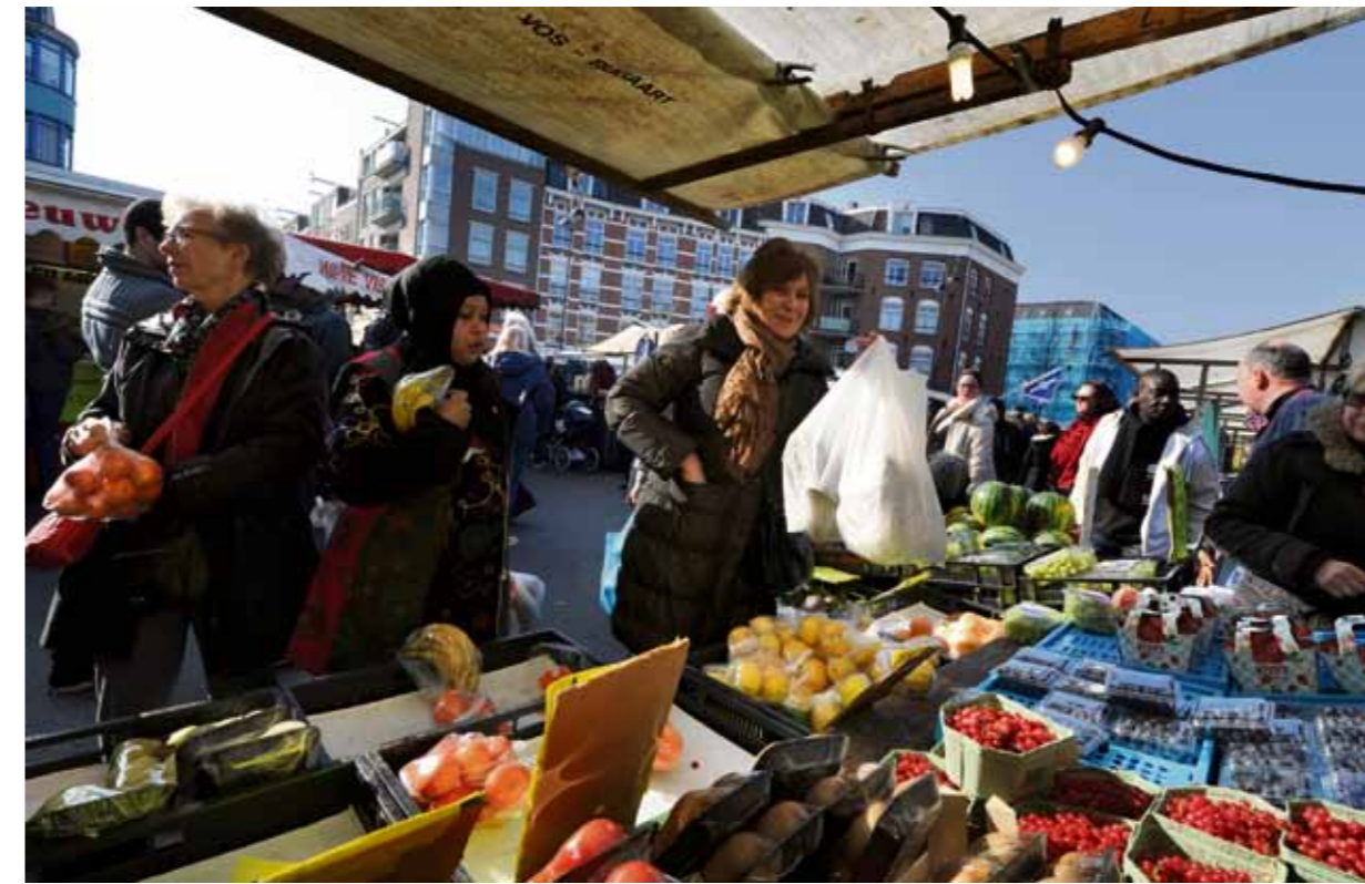
De Dappermarkt kwakkelde. Bij slecht weer staan er weinig kramen en het aanbod is niet divers genoeg. Op de markt wijten ze deze manco's aan het beleid van het stadsdeel en het markt bureau.