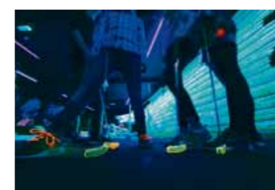
De nieuwe glowgolfruimte, mét blacklights.

Sinds kort kunnen bezoekers van dit grote attractiecentrum aan de De Ruijterkade niet alleen bowlen en lasergamen, maar ook glowgolfen. De baan heeft twaalf holes en is uitgevoerd in het thema Michiel de Ruyter en piraten. “Het decor, beschilderingen