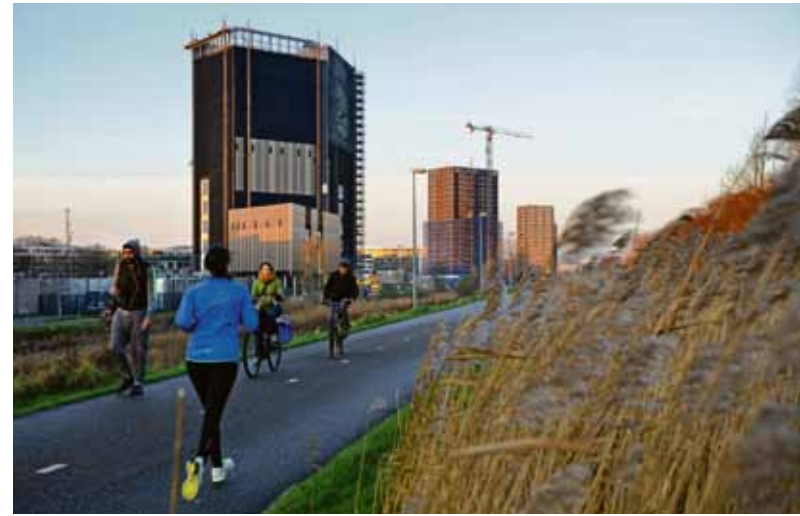
Het datacenter langs de Valentijnkade. “Het mooie van een dergelijke ontwerp is dat er nu eens geen rekening gehouden hoeft te worden met mensen.”

te worden met mensen. Er zijn geen mensen, het gebouw staat vol met computers en apparaten om de computers draaiende te houden. Voorspelbare gevels met een rij ramen per verdieping kunnen