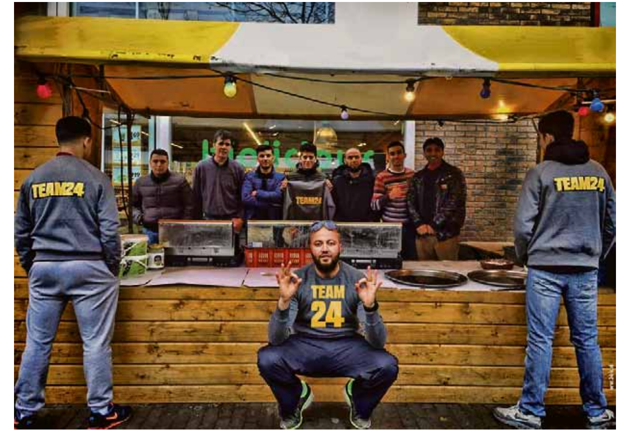
24 Karaat Werkt bij de oliebolletjeskraam op het Joris Ivensplein.

Het gaat erom, zegt hij dan weer serieus, dat we afstand beslechten en angst voor elkaar wegnemen. Thate durft, zegt Safoan, jongeren een kans te geven. Ze heeft onlangs Mo