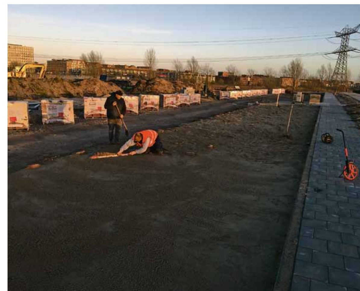
Op 19 januari wordt de parkeerplaats in het Diemerpark geasfalteerd.

De parkeerplaats komt te liggen in de noordwesthoek van het Diemerpark, net voorbij de brug aan het einde van de Oeverzeggestraat. Het wordt in het algemeen als ongestoord gezien dat de bezoekende clubs ongeveer een kwartier moeten wandelen wanneer zij parkeren in de dichtstbij gelegen wijk. In principe zijn de parkeerplaatsen alleen in het weekend toegankelijk. Soms, als een wedstrijd ingehaald moet worden, kan dat ook een keer doorde-weeks zijn.