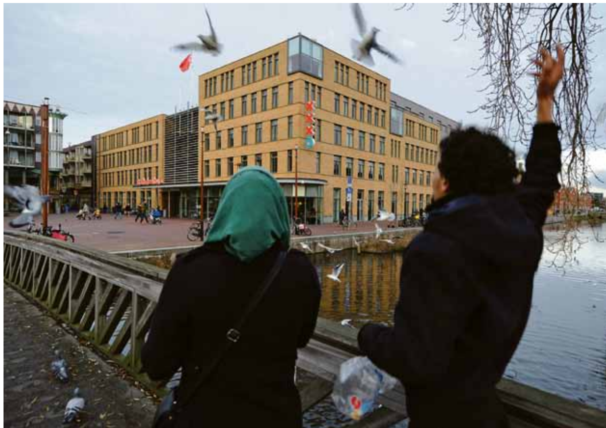
Al in 2013 bleek uit onderzoek van de Brug dat er veel onduidelijkheid is over besteding van subsidiegeld in Oost.

Subsidies en de kaasschaaf. Het zijn twee woorden waar een gemiddelde VVD-er van gaat steigeren, ook in oost. Dus toen hun voorstel voor een extern onderzoek naar de gesubsidieerden het niet haalde in de bestuurscommissie ging er meteen een ronkend persbericht uit. In Oost zou een ware 'subsidiechaos' zijn ontstaan en het dagelijks bestuur zou