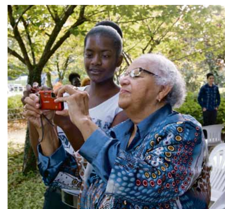
Twee keer kijken 2014.

Samen gingen ze de wijk in met een camera en volgden ze workshops over straat- en portretfotografie. De resultaten en alle verhalen worden in een eigen tentoonstelling gepresenteerd. De tentoonstelling van de editie in Oost wordt geopend op donderdag 17 december om 13.00 uur bij De Meevaart, Balistraat 48A. Het project wordt in het nieuwe jaar voortgezet en Foam zoekt