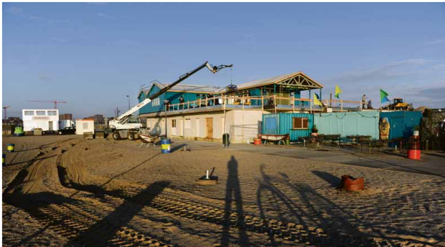
De definitieve versie van Blijburg op Centrumeiland wordt binnenkort geopend.