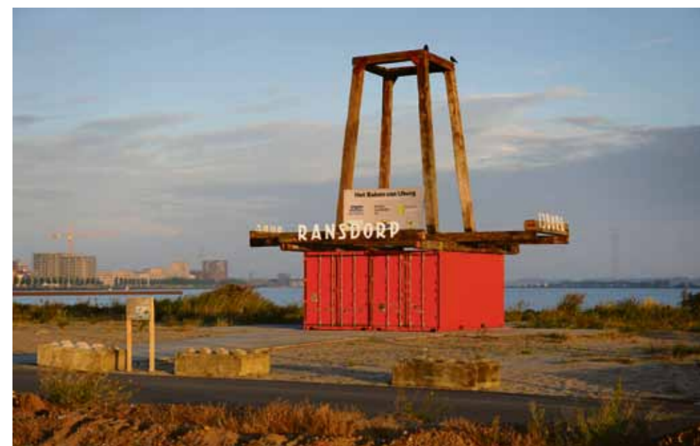
Met het Baken van IJburg op Centrumeiland heeft ook IJburg nu zijn stompe toren. Met uitzicht op de stompe torens van Muiderberg, Elburg en Ransdorp, allemaal 'het slachtoffer van de boegspriet van een kerend schip'. Ontwerper Wouter Valkenier gaf IJburg een eigen plek in een oude mythe over de Zuiderzee.

Zie amsterdam.nl/gebiedsontwikkeling en amsterdam.nl/zelfbouw voor meer informatie.