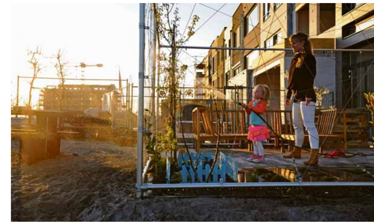
Uit de ontwikkeling van IJburg zijn lessen getrokken. Toen daar allang mensen woonden, waren er nauwelijks buitensport- en speelvoorzieningen. Op Zeeburgereiland wil de gemeente deze juist versneld realiseren.

Bijzonder is dat de sportzone er komt met inspraak van omwonenden, belanghebbenden en sporters zelf. Zij kwamen in april bij elkaar voor een eerste overleg. Tijdens een volgende bijeenkomst – waarschijnlijk in mei –