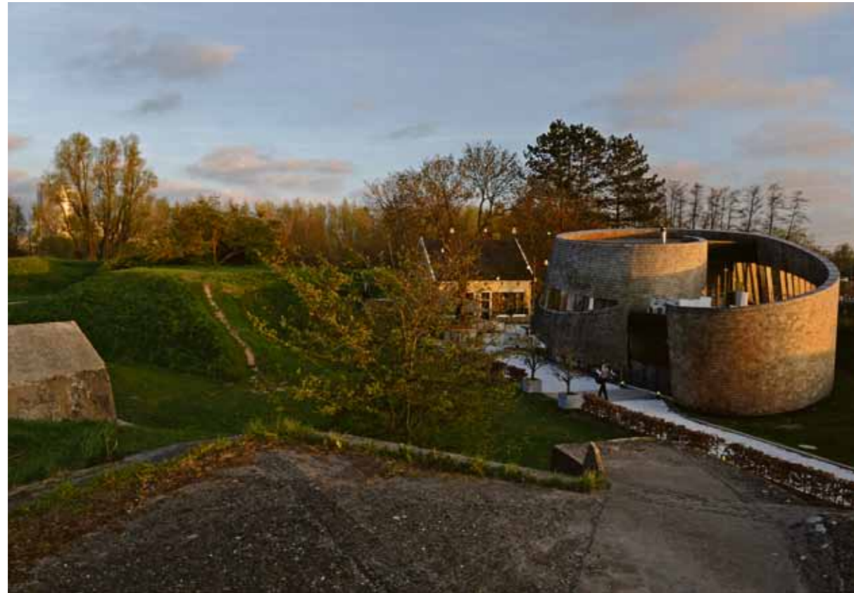
“Paviljoen Puur is een verrijking van de oude structuren.”

Toen wij in 2005 op IJburg kwamen wonen troffen we een desolaat landschap van zandvlaktes, met gras begroeide zandhopen en een paar gebouwen. ‘Gazastrook’ noemde mijn schoonmoeder het. Niets op IJburg is ouder dan vijftien jaar. Een gek gevoel als je de binnenstad van Amsterdam gewend bent.