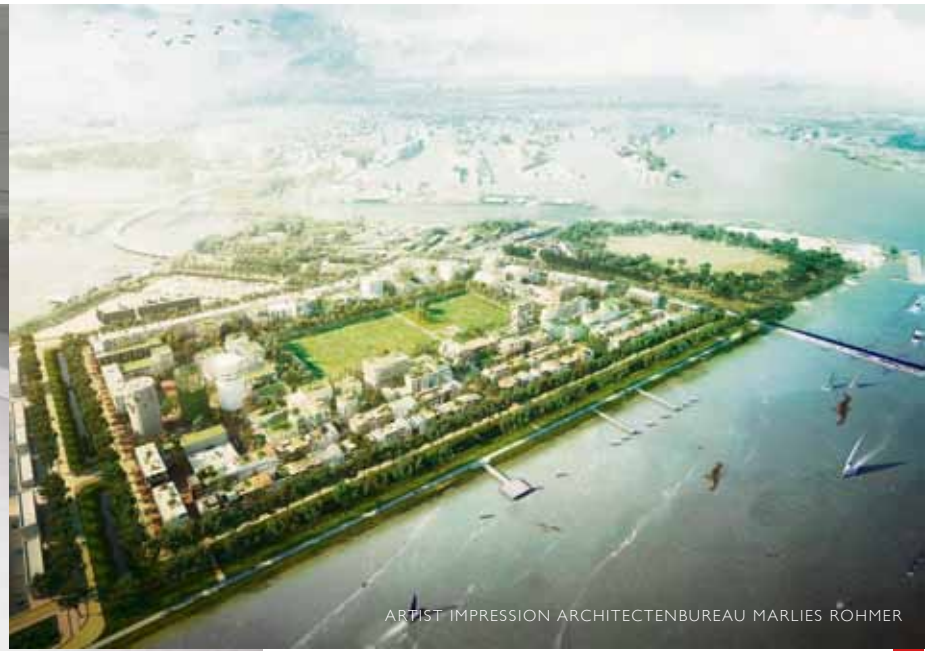
ARTIST IMPRESSION ARCHITECTENBUREAU MARLIES RÖHMER