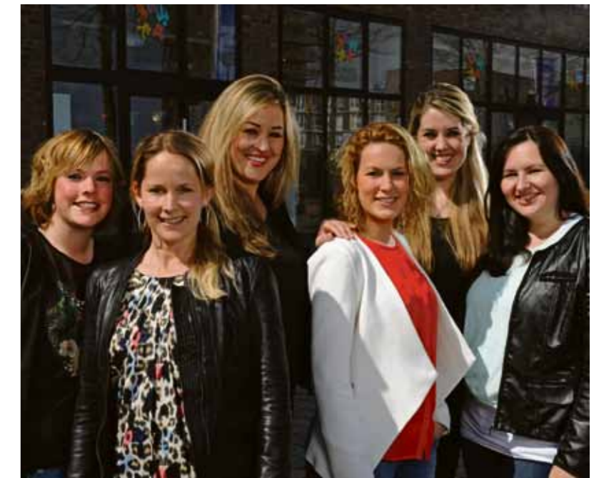
Team UniKidz Group.

Je kunt buiten schooltijd aan diverse cursussen en workshops