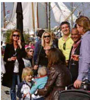
Open Haven Festival.