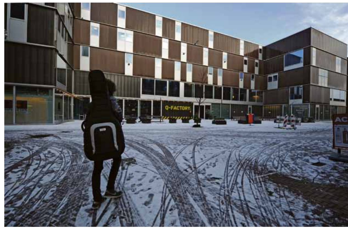
Q-factory in de nieuwe wijk Oostpoort. "Gemiste kans, gemiste kans."