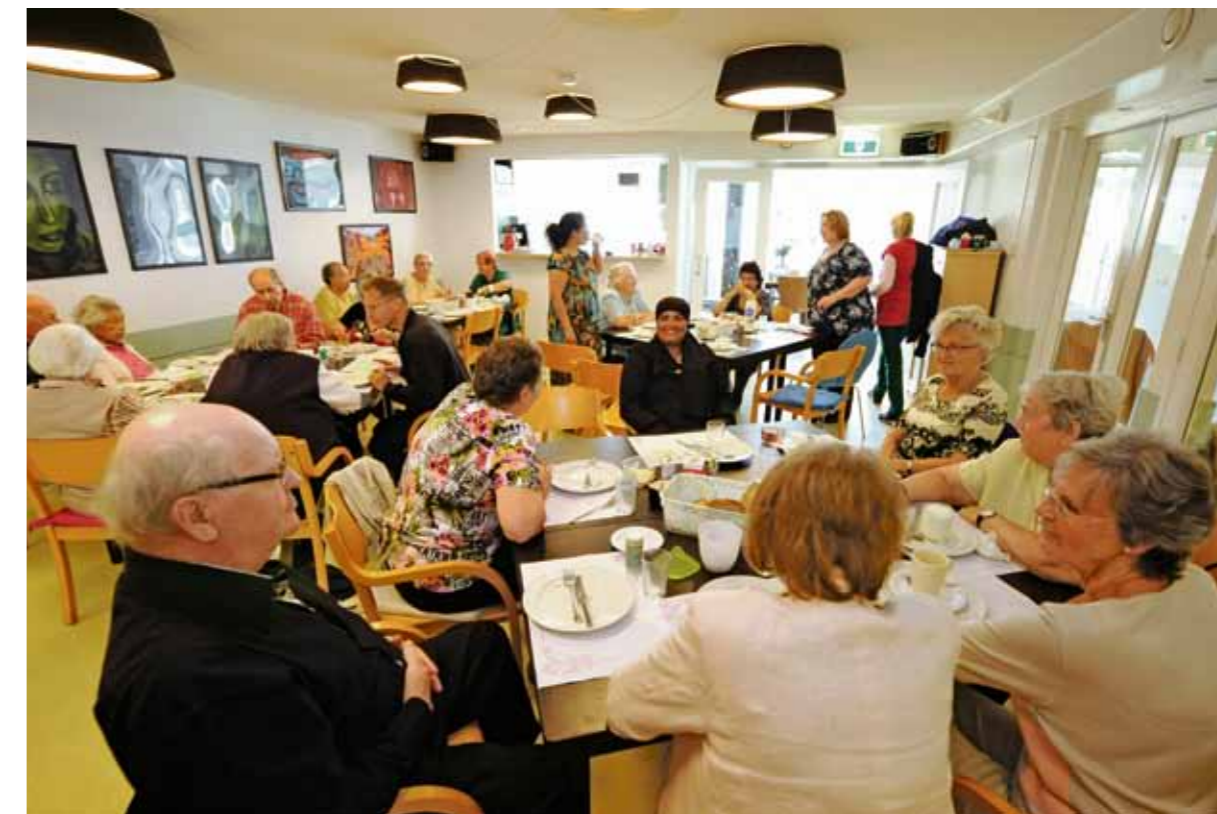
Koffieochtend in Het Hoekhuis.

Eind augustus heropende het Hoekhuis haar deuren voor de buurt. Het wijkservicepunt van Zorggroep Amsterdam Oost (ZGAO) in de Fizeastraat is afgelopen voorjaar ingrijpend verbouwd. Met lichtere ruimten, een prettiger indeling én nieuwe activiteiten is het Hoekhuis een volwaardige ontmoetingsplek voor jong en oud.