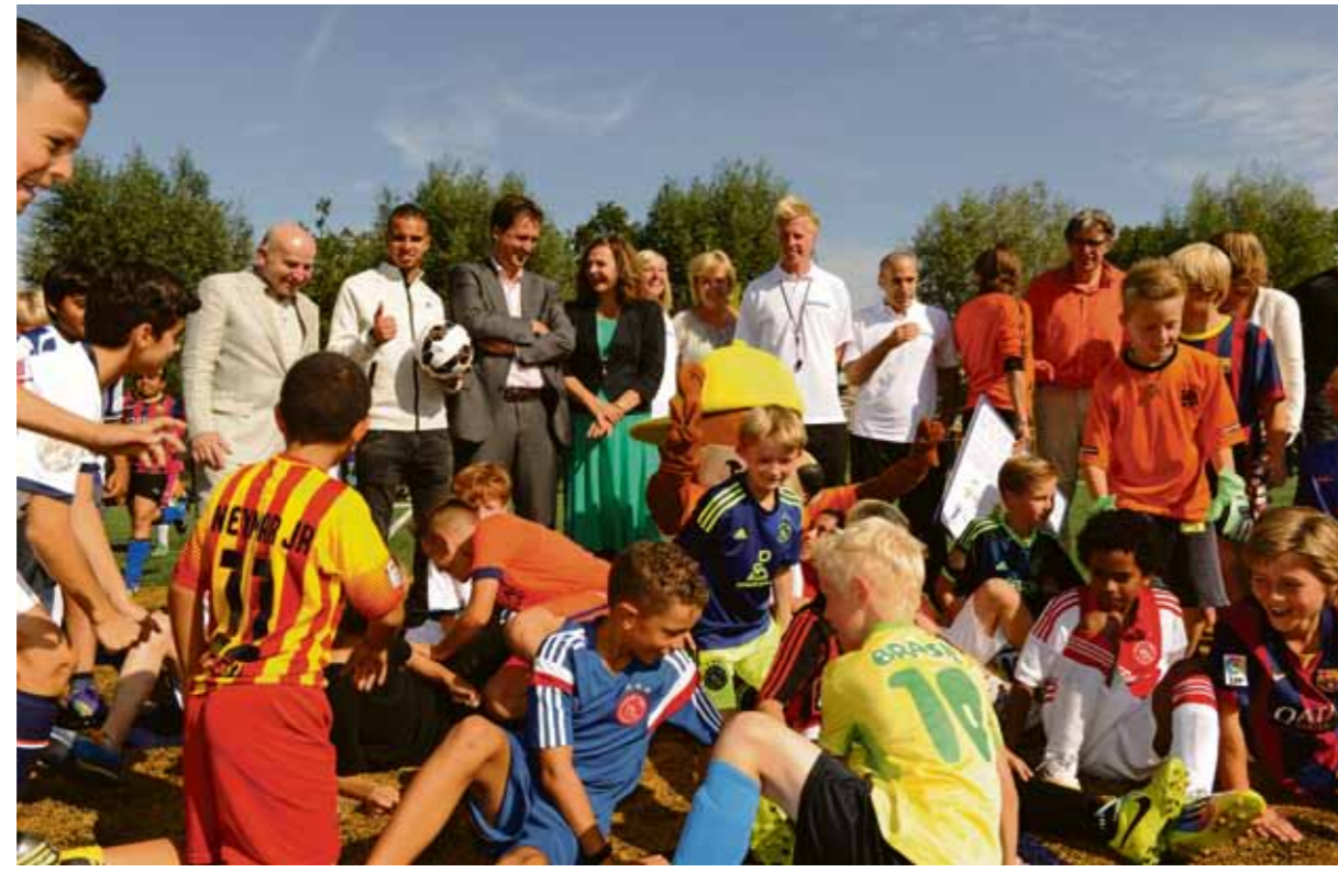
Tal van prominenten kwamen bijeen om de opening van het Cruyff Court van Adam Maher mee te maken. Onder anderen Maher zelf, Philips Cocu en minister Edith Schippers.

Het is mede daarom dat minister Schippers ondanks haar drukke agenda toch een gaatje heeft gevonden om langs te komen. "Het is zo belangrijk dat jongeren met elkaar spor-