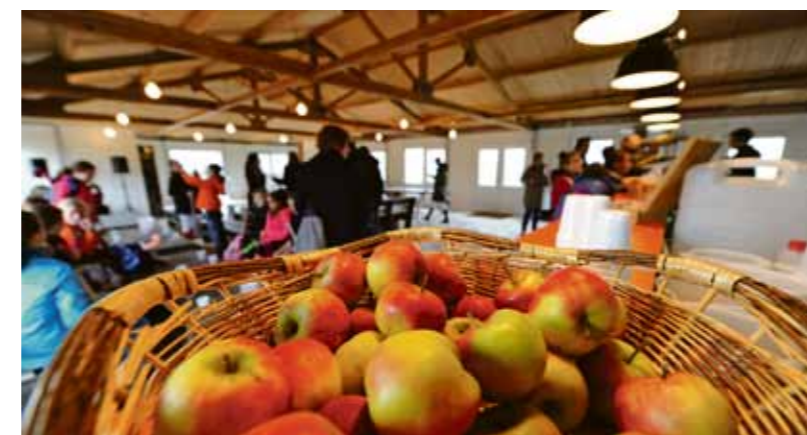
In het clubhuis van AHC IJburg vinden de gratis appels gretig aftrek.

De gratis appels in het clubhuis vinden in ieder geval al gretig