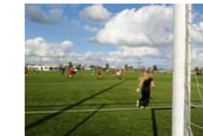
AFC IJburg.

Dankzij een originele pitch heeft AFC IJburg zich verze-