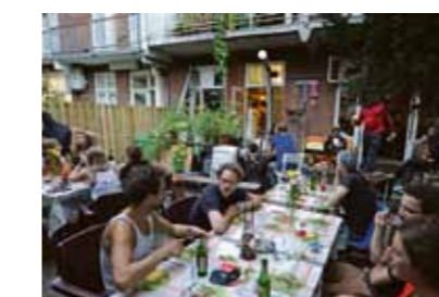
Joe's Garage.

"Kraken zit weer lekker in de lift," stelt Rogier tevreden. "Dat komt doordat de woonproblemen in Amsterdam niet zijn opgelost. Er is woningnood, leegstand, er zijn onbetaalbare woningen. En mensen schudden de eerste schrik van de antikraakwet van zich af. Door