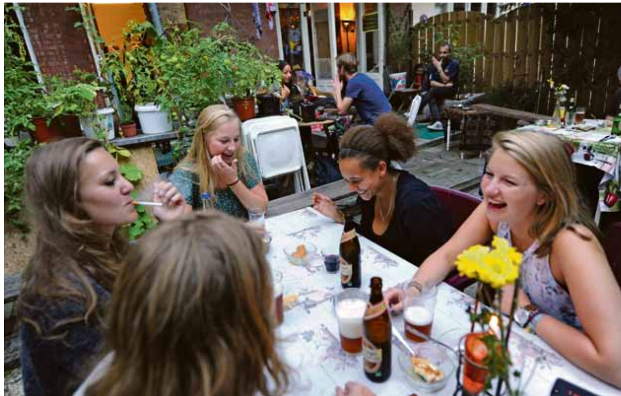
Op donderdagavond is er in Joe's Garage het wijkrestaurant, ook geopend voor de buurt. Om 22.00 uur gaat de tuindicht, om geen overlast te bezorgen.

Vanavond was het rustig, vertelt Simon. Maar vorige week had hij twintig man voor de deur.