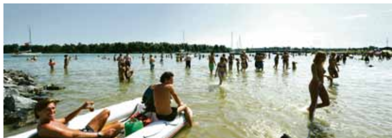
Strand Blijburg.

Amsterdam kan op 27 en 28 september nog één keer losgaan in het paviljoen aan het geliefde stadsstrand. Blijburg gaat verkasen en pakt – voordat het tijdelijk zijn deuren sluit – nog één keer groots uit met diverse dj's en liveoptredens, de saunakaravaan (compleet met zweethut), kampvuren en nog veel meer.