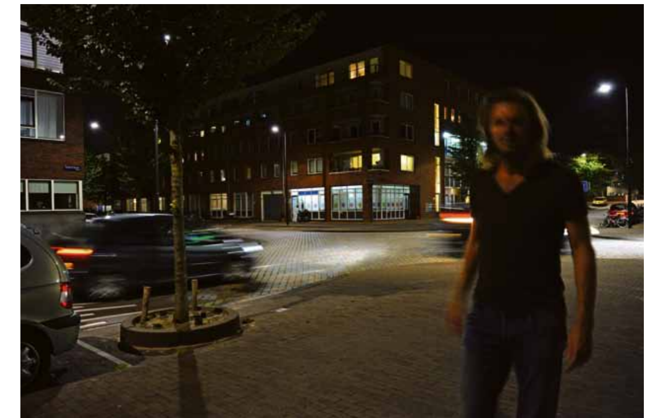
De Erich Salomonstraat waar moskee Al-Fourkane is gevestigd.

Verder schrijft het bestuur: "Door gebeurtenissen elders in de wereld, wordt de bezorgdheid van mensen groter. Ook wij maken ons zorgen hierover. Maar in plaats van het trekken van onterechte conclusies en