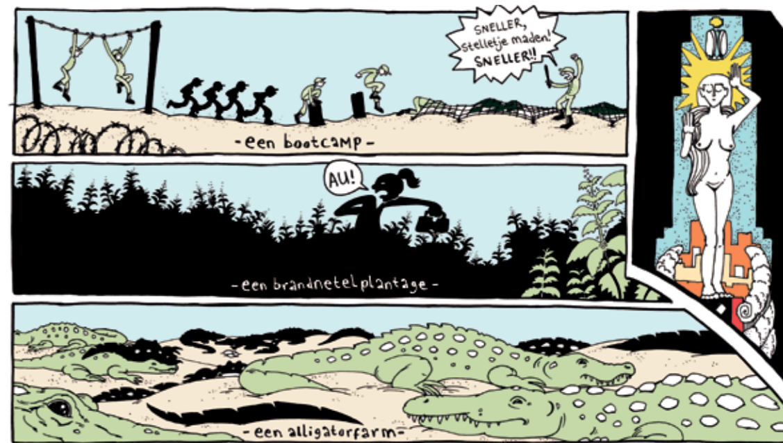
Zomaar 3 dingen die knusser zijn dan Winkelcentrum Oostpoort...