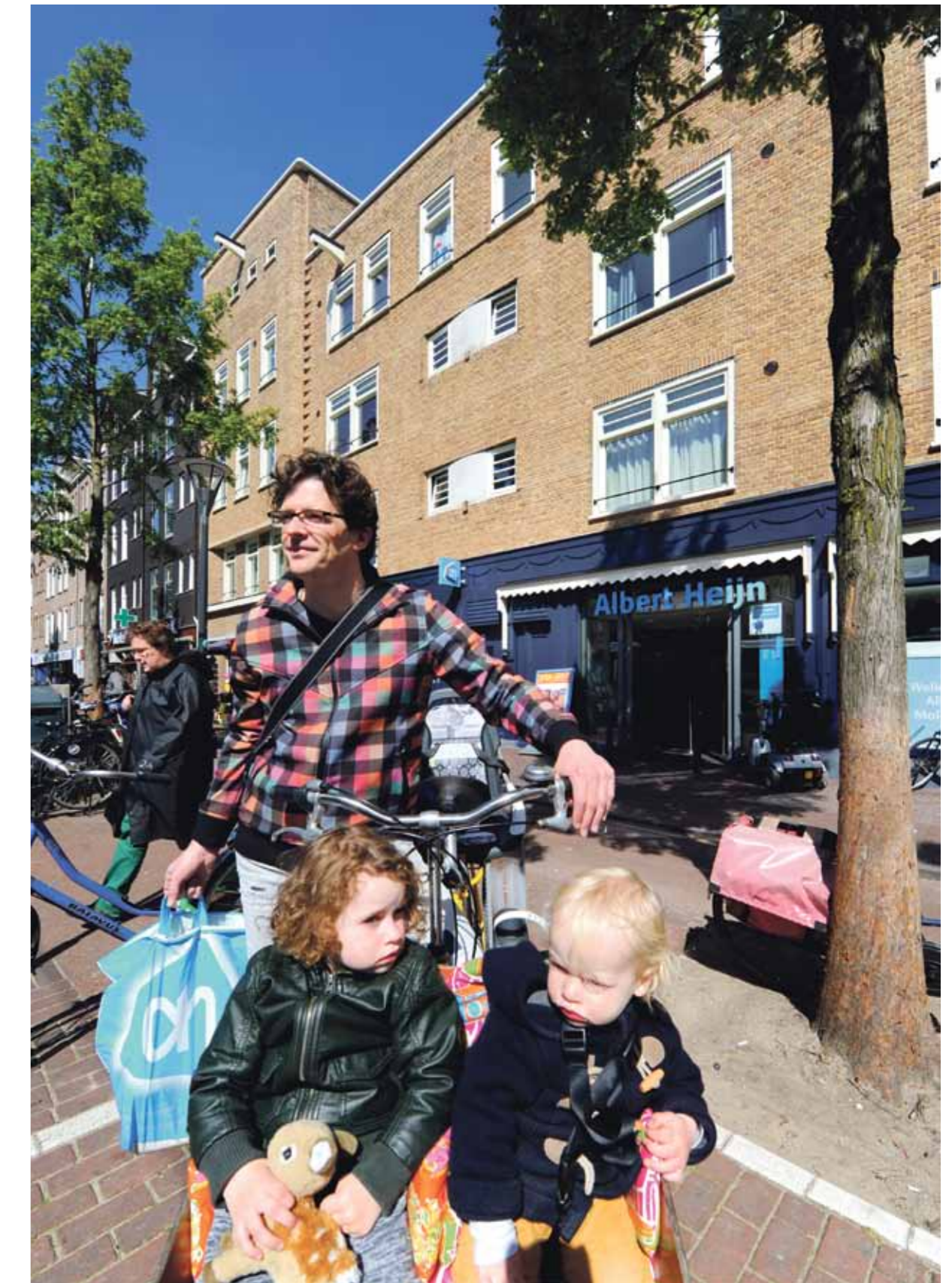
In het pand aan de Molukkenstraat waar nu supermarkt Albert Heijn gevestigd zit, kwam van 1928 tot 1942 een deel van de zeshonderd Joodse bewoners van de Indische Buurt samen voor diensten, lezingen en cursussen.