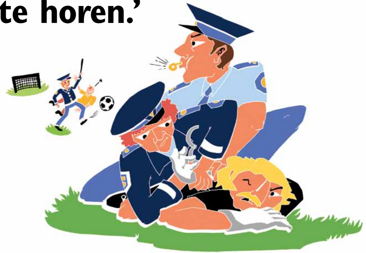
ILLUSTRATIE MEREL BARENDIS

"Een flinke teleurstelling," aldus De Bruijne. "We hadden er hard voor getraind. En als je die kwalificatie door komt, wil je spelen ook. Na dat fiasco zijn de zaken gelukkiger wat professioneler aangepakt. Er zijn sponsors gevonden en nu zijn er goede afspraken gemaakt."