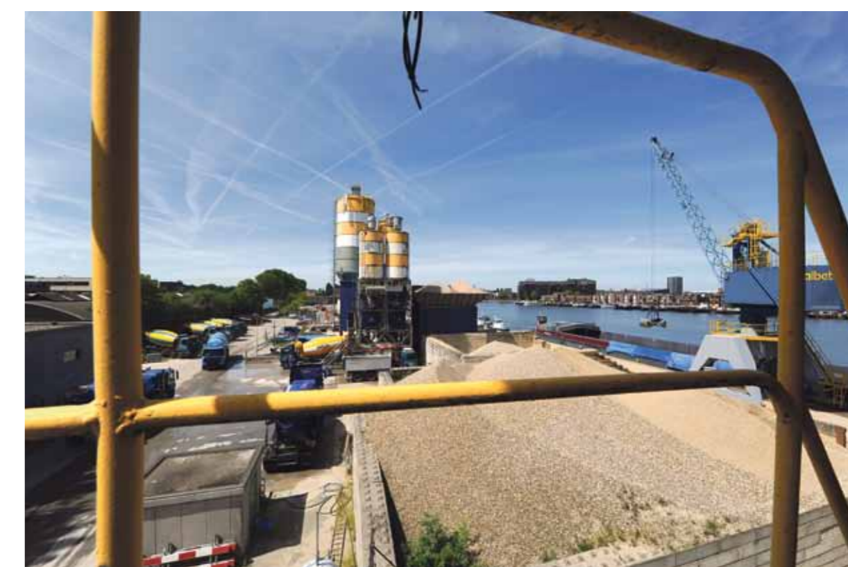
De betonmortelcentrale van Albeton in het Cruquiusgebied gaat deze zomer nog tegen de vlakte om ruimte te maken voor woningen.

Het eerste gebouw met appartementen komt op de Cruquiusweg nummer 67, op een steenworp afstand van het restaurant. Nu is Albeton er nog gevestigd. Het bedrijf, dat al ruim veertig jaar betonmortel produceert voor de bouwsector in de regio Amsterdam, gaat in augustus verhuizen. Kuijs: "Een sloopbedrijf zal vanaf september de centrale ontmantelen." Hij verwacht dat de eerste steen van