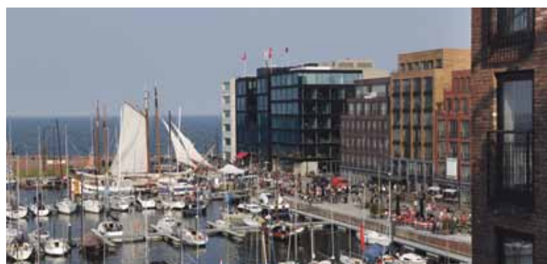
Haven IJburg.

Op zondag 25 mei barst het jaarlijkse watersportfestijn op IJburg weer los. In samenwerking met de Watersport Vereniging en lokale ondernemers organiseren buurtbewoners ook dit jaar weer een gezellige middag. Klassieke schepen bekijken, kanoën, suppen, varen in een optimist, het kan allemaal. Er is een braderie