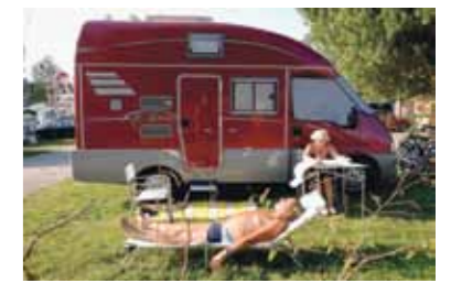
Ook pensionado's strijken neer op de camping aan de Zuider IJdijk.

Wie gratis wil kamperen, moet een mailtje sturen naar info@campingzeeburg.nl . De toegang tot de Open Tent is gratis. Zie campingzeeburg.nl .