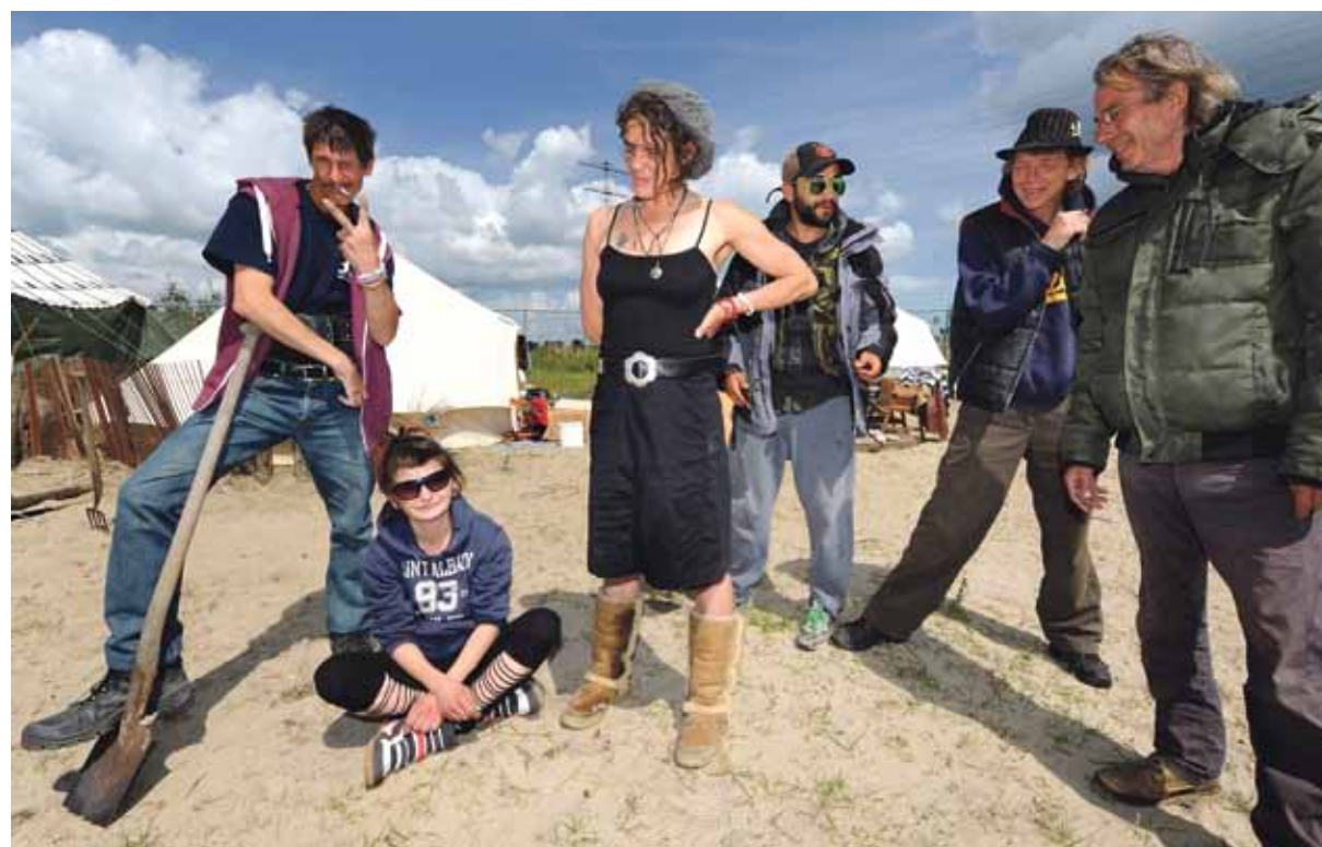
Lees op pagina 3 over de landkrakers en wat de gemeente van ze vindt.

De eigenaar van het nabijgelegen café-restaurant Magnetico