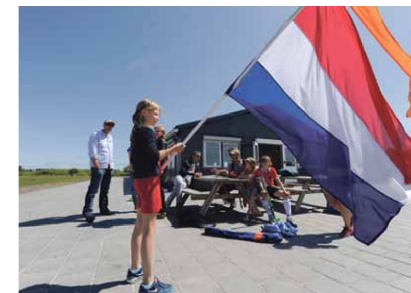
In het clubhuis van AHC IJburg worden alle wedstrijden van het WK Hockey (31-15 juni) op groot scherm getoond en vinden tegelijkertijd allerlei vrolijke evenementen plaats.

De jeugdleden nemen op woensdag 28 mei het clubhuis onder handen. Ze versieren het onderkomen van de club met oranje en rood-wit-blauwe decoraties. Drie dagen later is de kick-off van