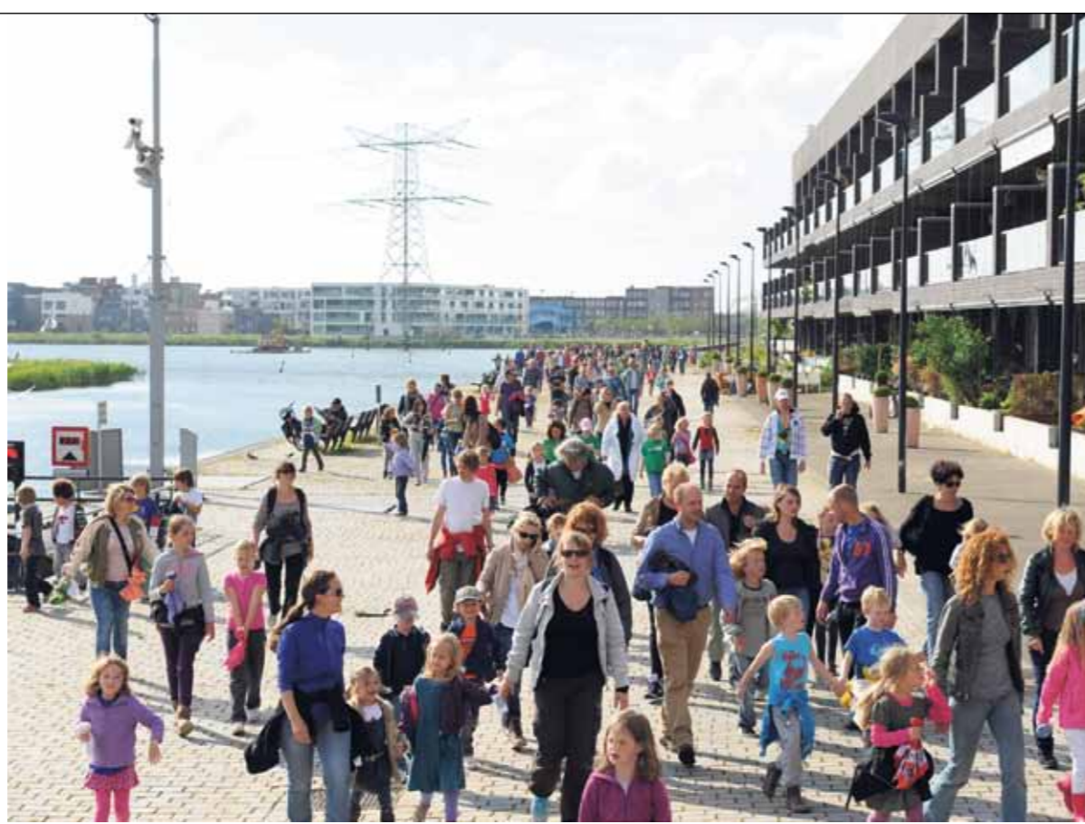
Avondvierdaagse 2013.

Biolicious zorgt voor smoothies en gezonde haver- of muesliokken. Om 18.00 uur gaat de 10 kilometertocht van start, om 18.15 uur volgt de 5 kilometer. Naderhand kunnen mensen ook weer iets eten of drinken en uitrusten bij de picknicktafels. De laatste avond is als altijd de medaille-uitreiking, met een feest als afsluiting. "Zo kan iedereen gezellig napraten en dansen op muziek van de dj," zegt Thate. Het feest start zodra de eerste wandelaars binnenkomen, waarschijnlijk rond halfacht.