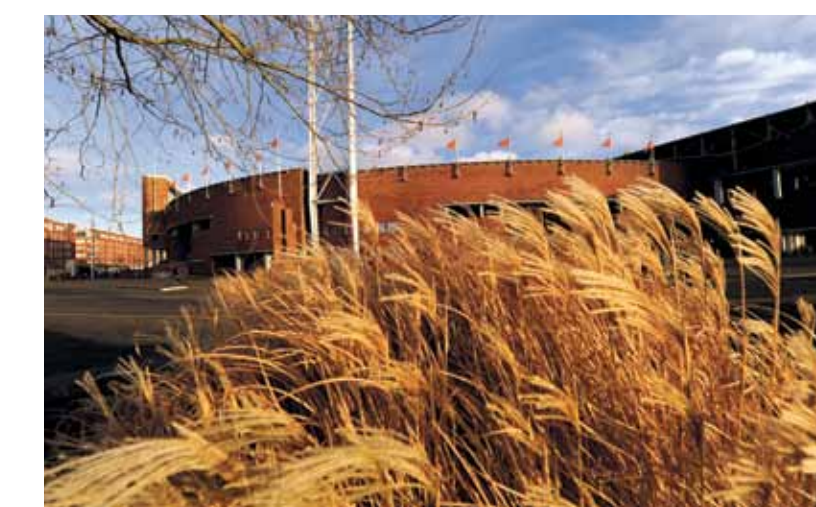
Olympisch Stadion.

meer openlijk voor iets anders kiezen maar waarschijnlijk heb ik hier nu voor de rest van mijn leven spijt van. Ik zeg het maar gewoon, het is een Pentax geworden. Mijn aparte persoon kan natuurlijk nooit met een banaal merk als Canon komen, zo ben ik gewoon niet. Nikon past alweer wat beter bij mij maar toch is het nog te makkelijk, er schuilt een legendarische fotograaf in mij, ik moet anders zijn. Ik ga een nieuwe richting in de fotografie onthullen en dat moet ik op zo een manier doen dat al die walgelijke Canon/Nikon-gebruikers daar niets van kunnen claimen, de ratten. Het is oorlog mensen. Muziek heb ik nu al gedaan, ik ga de wereld nóg een keer veranderen. Wees niet bang dit is het lot. Oké. Laat ik beginnen. Met een selfie.