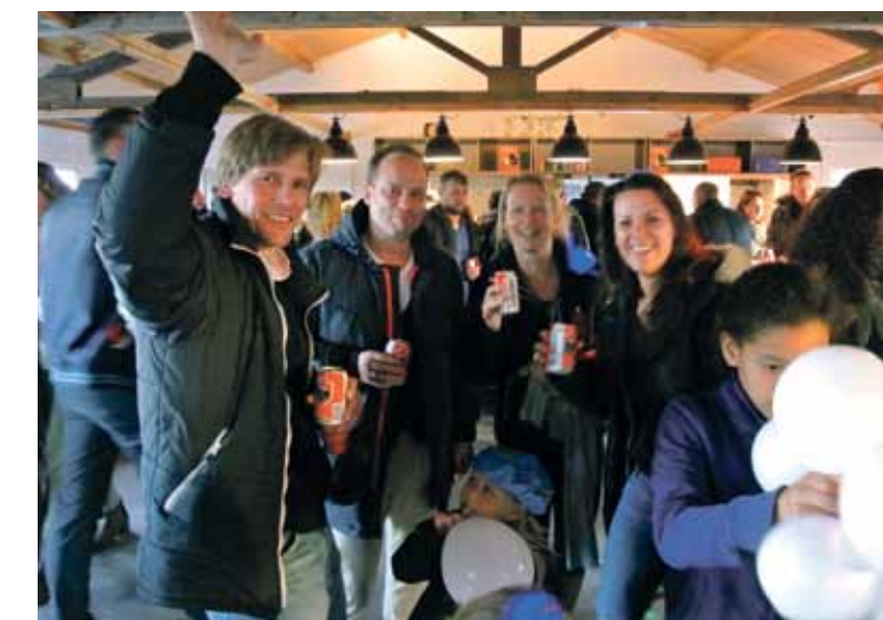
Het nieuwe clubhuis van AHC IJburg wordt inmiddels warm gebruikt, hier door de MD4.

dagavond om 8 uur spelen de trimhockeyers, ook in deze wintermaanden. De woensdag is er voor de beginners met instructie en een klein partijtje. Op de maandag spelen de