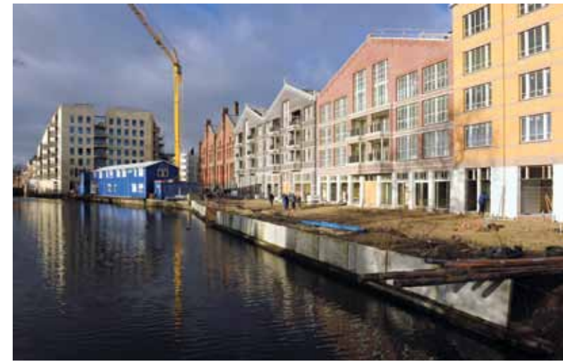
De Oranje-Vrijstaatkade, een mix tussen de oude karakteristieke gebouwen van de Oostergasfabriek met nieuwbouw die hierop geïnspireerd is.

De nieuwe bewoners – tot nu toe allemaal erg tevreden – zijn al net zo gemêleerd. Sommigen zijn zijn jong, anderen juist oud. Ze komen uit Oost of uit andere stadsdelen, maar er zit