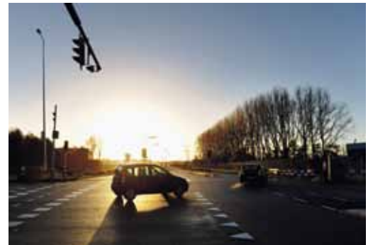
Overdiemerweg, ofwel Nuonweg.

Het aanbod op IJburg voldoet hierdoor niet aan de eisen van de huidige bewoners, die nu zijn aangewezen op voorzieningen buiten het eigen gebied. Afsluiting van de 'Nuonweg' zou de bereikbaarheid hiervan ernstig belemmeren. Ook jongeren uit de omgeving die per fiets op IJburg naar school gaan zouden door de sluiting van de