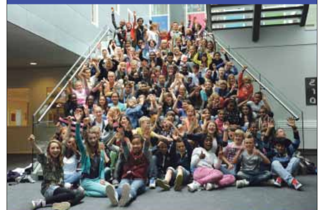
IJburg College 1

Open avond VMBO woensdag 19 februari 18.30 - 21.30 uur