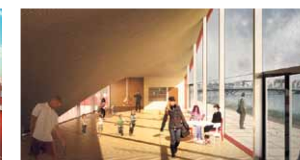
Het tennisclubhuis – een ontwerp van het wereldberoemde Rotterdamse architectenbureau MVRDV – moet nog gebouwd, maar is nu al wereldberoemd. ARTIST IMPRESSIONS

glas en een dak van gravelrood kunststof dat van het gebouw op slag een spektakel maakt. Het gegolfd dak (de tribune) is aan de waterkant zeven meter hoog, waardoor er een uitzichtpunt ontstaat. Aan de kant van de tennisbaan buigt het helemaal door tot op de grond. "Eenvoudig en ingenieur. En het heeft precies de vernieuwende, 'anders dan anders' uitstraling waar wij naar op zoek waren." Maas noemde