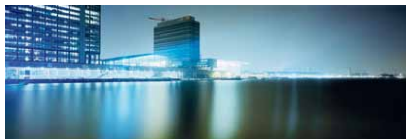
In het midden Muziekgebouw aan 't IJ.

Kiss of fire, 14 februari, 20.15 uur, Muziekgebouw aan 't IJ, Kaarten via orchestraunplugged.nl.