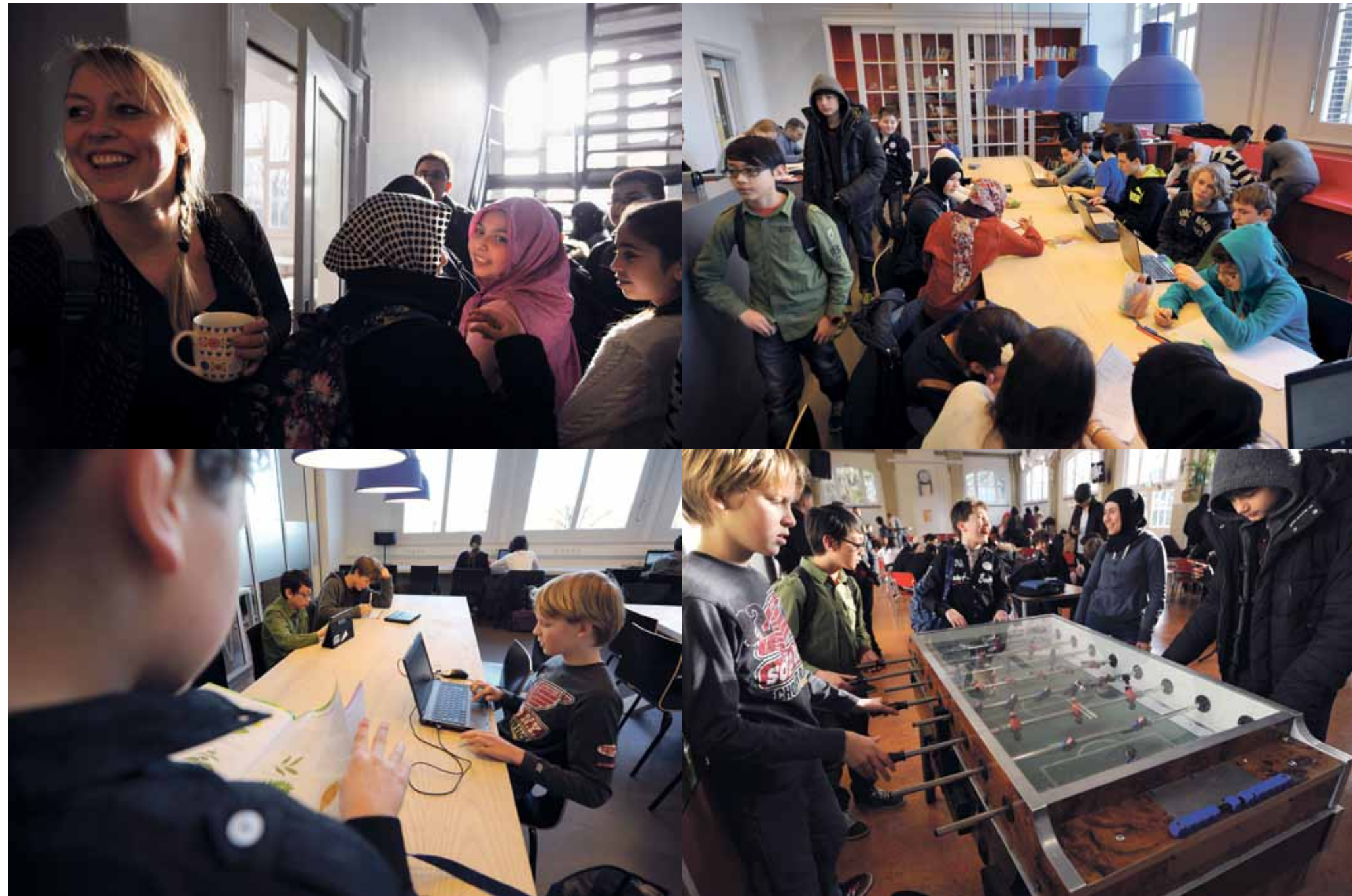
Leerlingen in het Cosmicus Montessori Lyceum.

Wat je van ons moet weten Het CML is een jonge, ambitieuze school in Amsterdam Oost en onderdeel van de Montessori Scholengemeenschap Amsterdam. Er werken docenten die meer willen dan alleen hun kennis overdragen. Ze willen hun enthousiasme op jou overdragen. Dat betekent niet dat je elk vak 'leuk' moet vinden, maar het betekent wel dat je wordt aangesproken op je eigen niveau en op je eigen interesses. Als die samenkomen, kun je meer dan je eerst voor mogelijk had gehouden.