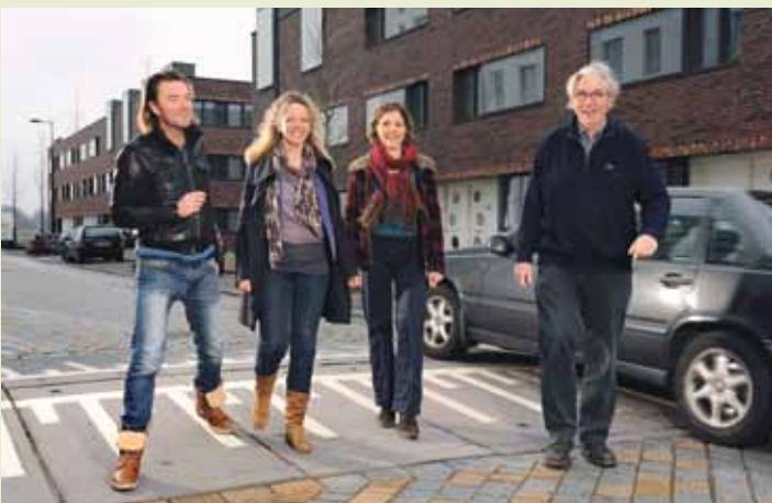
Een deel van het bestuur van Stichting Parentshouse, dat er kwam dankzij hun gezamenlijke inspanningen.