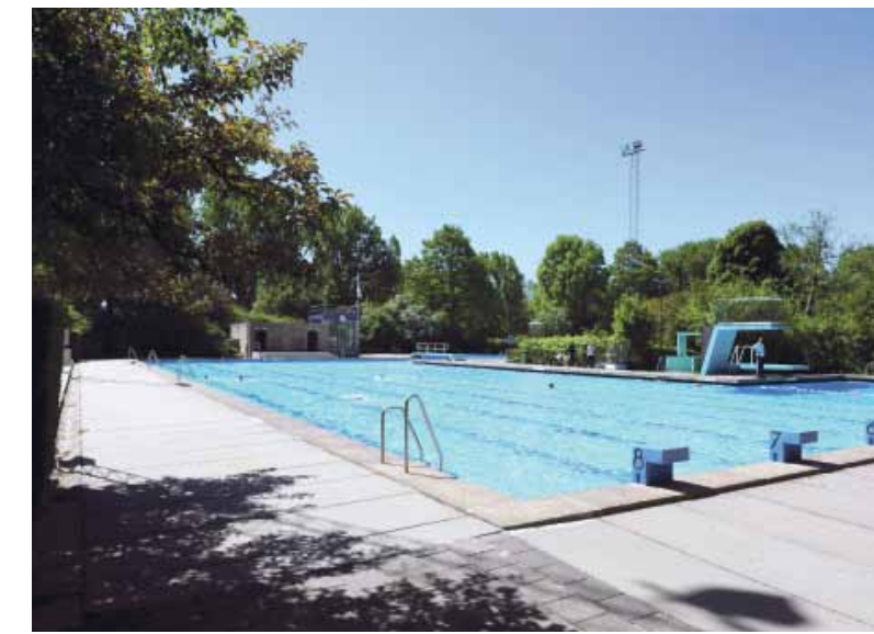
Het Flevoparkbad, het buitenbad olympische afmeting.

En zo ziet de toekomst van Flevoparkbad er weer florisant uit. Hoe anders was dat ander-