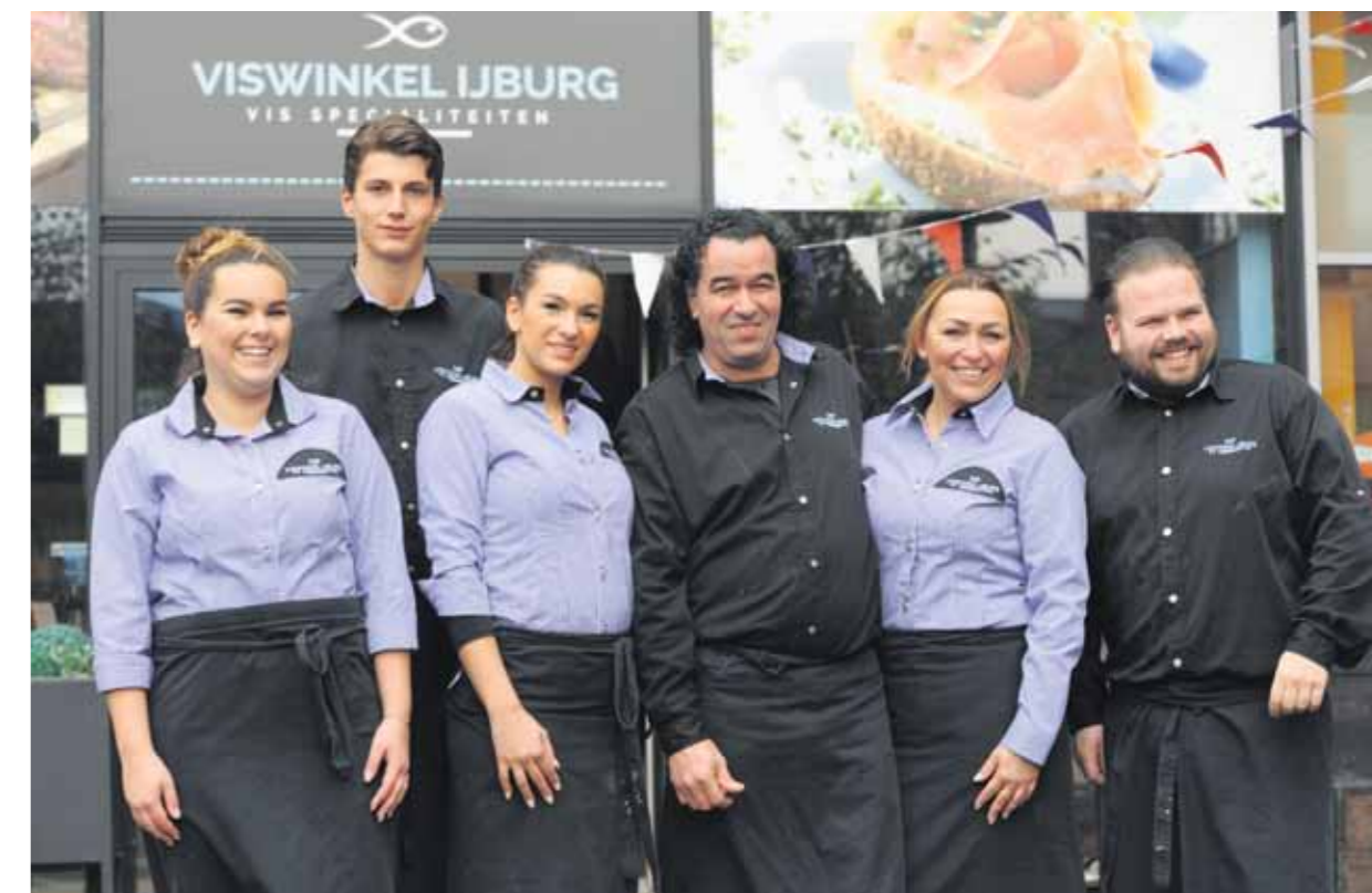
Team Viswinkel IJburg.