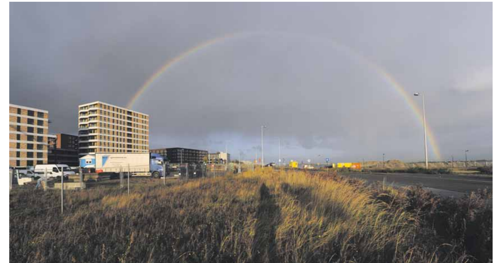
Het huidige beeld vanaf het werkterrein. Om ruimte te maken voor de aanleg van brug 2030 is hard gewerkt aan het verleggen van de weg.

De watergang tussen Centrummeiland en Havenmeiland zal uiteindelijk twee keer zo breed worden als het deel dat er nu ligt. Het water wordt bevaarbaar, maar loopt de komende jaren nog dood op de dam aan de westkant. De aanleg van de brug op die plek – in het verlengde van de Pampuslaan – laat name-