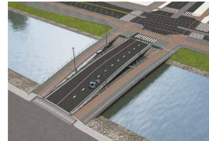
Brug 2030, die vanaf 2018 Havenmeiland en Centrummeiland met elkaar verbindt. ARTIST IMPRESSION/GEMEENTE AMSTERDAM