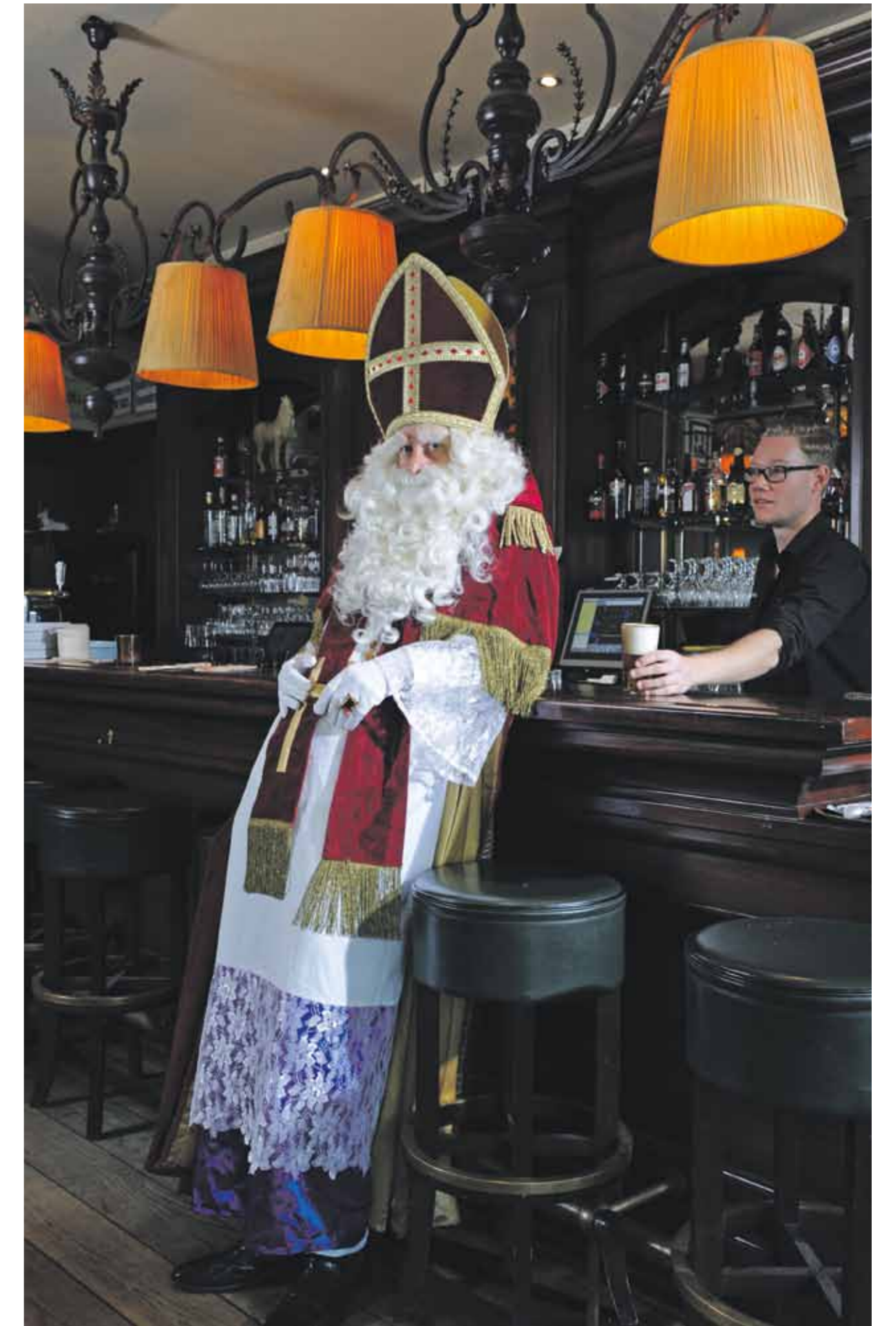
‘Ik kom graag in café-restaurant Frankendaal, nadeel is wel dat de eigenaar het altijd over AFC heeft.’

Dat is wel heel lang geleden. “Ik ben een rancuneus mannetje. Ik heb wel meer slechte eigenschappen. Zo weet ik geen maat te houden. Sigaren, bonbons, drank; het moet allemaal op. Het banket van bakkerij Balvert aan de Middenweg is het beste. Dat vreet ik achter elkaar weg, ja dat is vreten. Soms vraag