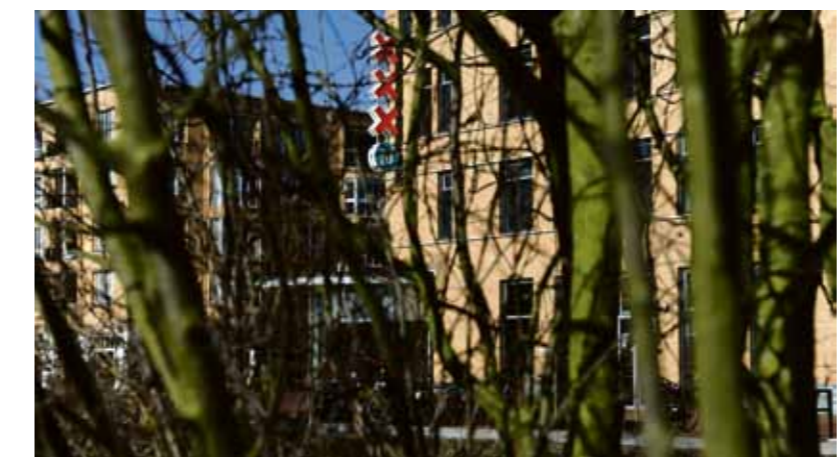
Stadsdeelhuis Oranje Vrijstaatkade.

Het college van B en W heeft alle stadsdelen bezuinigingen opgelegd. Voor de hele stad gaat het om een bedrag van 14 miljoen euro, stadsdeel Oost moet 2,4 miljoen euro aan besparingen zien door te voeren. In een brief aan het college stelt de bestuurscommissie Oost alle budgetten kritisch te hebben doorgenomen en concludeert dat een besparing van circa 600.000 euro kan worden doorgevoerd "zonder dat dit vergaande consequenties heeft voor de inwoners van Oost".