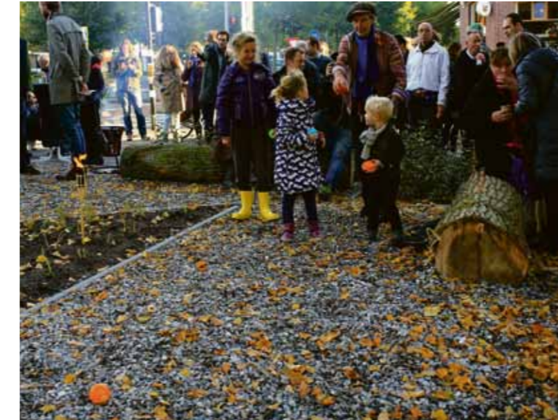
Voor de kinderen waren er tijdens de opening spelletjes georganiseerd.