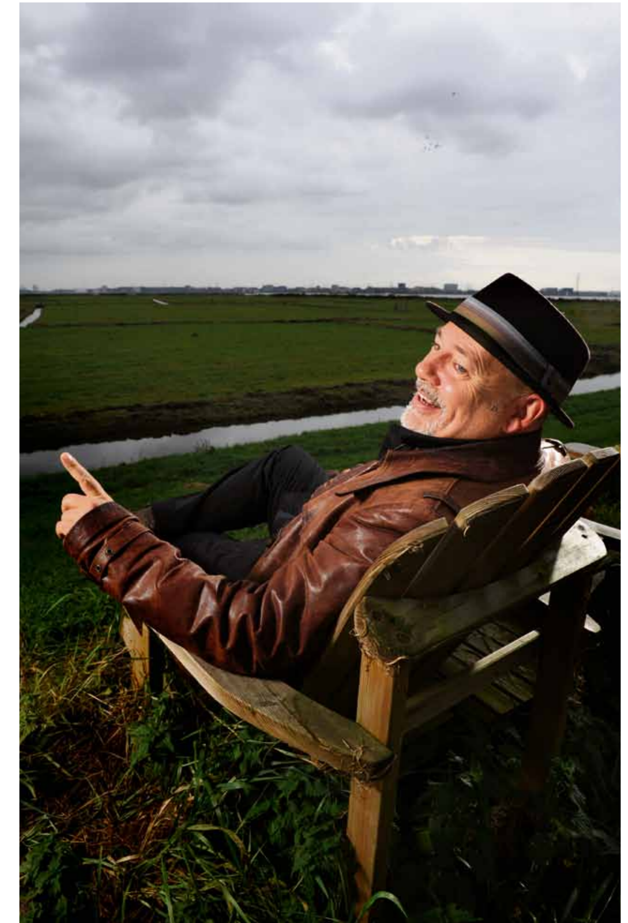
“De stad ruikt op. Ik heb nog geluk dat ik aan het eind van de dijk zit.”

“Een bioscoopje pakken is wel lastig, zeker met een kind. Al moet ik zeggen dat wij mazzel hebben want er woont hier een drieling aan de dijk. Die passen allemaal op. Als je nog heel veel uit wilt gaan kan ik me voorstellen dat Durgerdam niet ideaal is, maar ik heb daar geen last van. Ik sta iedere avond in het theater.”