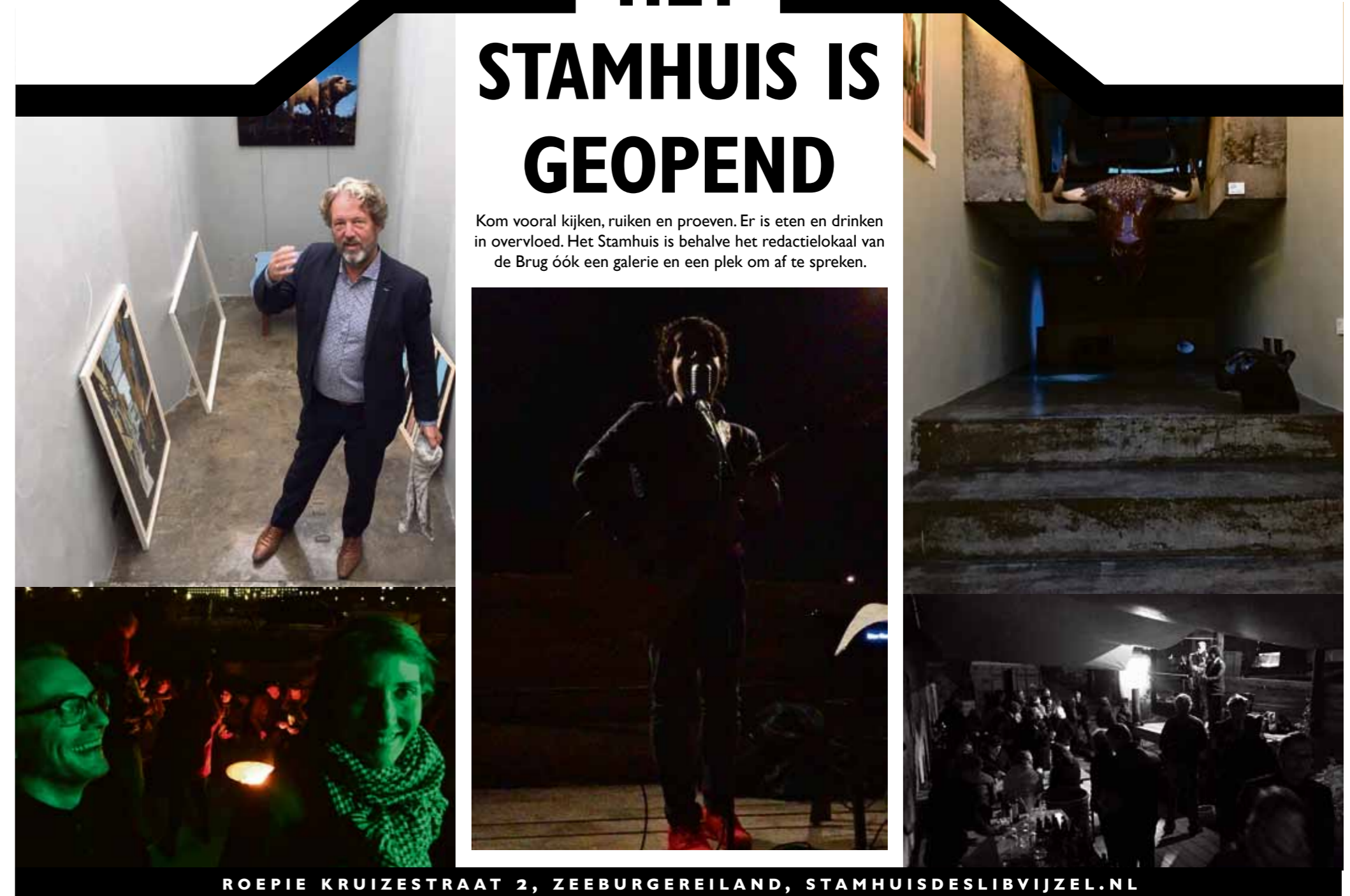
ROEPIE KRUIZESTRAAT 2, ZEEBURGEREILAND, STAMHUISDESLIBVIJZEL.NL

Kom vooral kijken, ruiken en proeven. Er is eten en drinken in overvloed. Het Stamhuis is behalve het redactielokaal van de Brug óók een galerie en een plek om af te spreken.