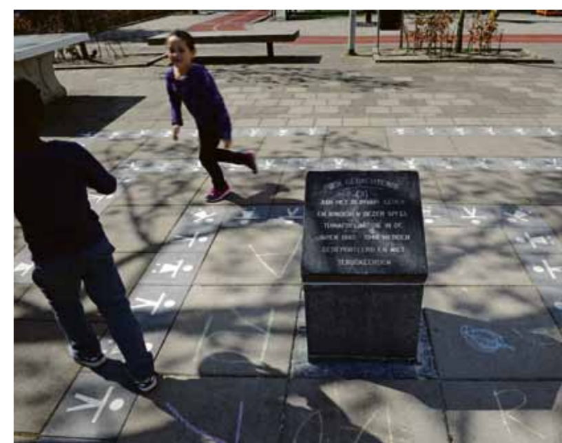
Oorlogsmonument Joubertstraat, Transvaalbuurt.

4 en 5 mei activiteiten in Oost Ook dit jaar zijn er weer veel activiteiten in Oost. Verdeeld over het stadsdeel zijn er op 4 mei zeven herdenkingen. Die in Loods 6 op KNSM-eiland begint om 15.00 uur. Verder zijn er verhalen te horen in huizen waar voor de oorlog Joden woonden en zijn er verschillende verzetsverhalen op locatie. Op 5 mei zijn op verschillende plekken vrijheidsdinners. Kijk voor het volledige programma op: www.4en5meiamsterdam.nl/