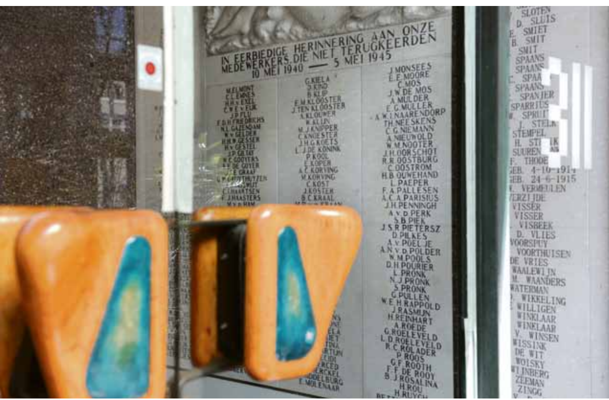
Op KNSM-eiland in Loods 6 worden de mannen omgekomen op de vaart herdacht.