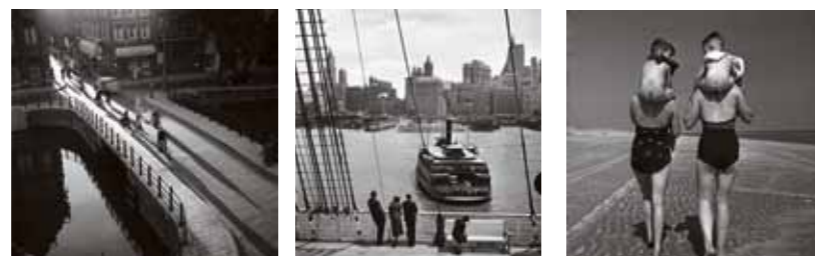
zomer 1946

Veel straten op IJburg zijn genoemd naar fotografen die hun vak uitoefenden in de tweede helft van de vorige eeuw. Hun vakmanschap is fenomenaal.