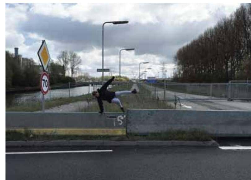
Hekken voor de Nuonweg. Heropening van de weg is opgenomen in het coalitieakkoord van het huidige B&W. Maar maakt iemand zich nog druk om dit onderwerp?

Immiddels is het april 2016. Wie naar de Maxis wil, rijdt al 21