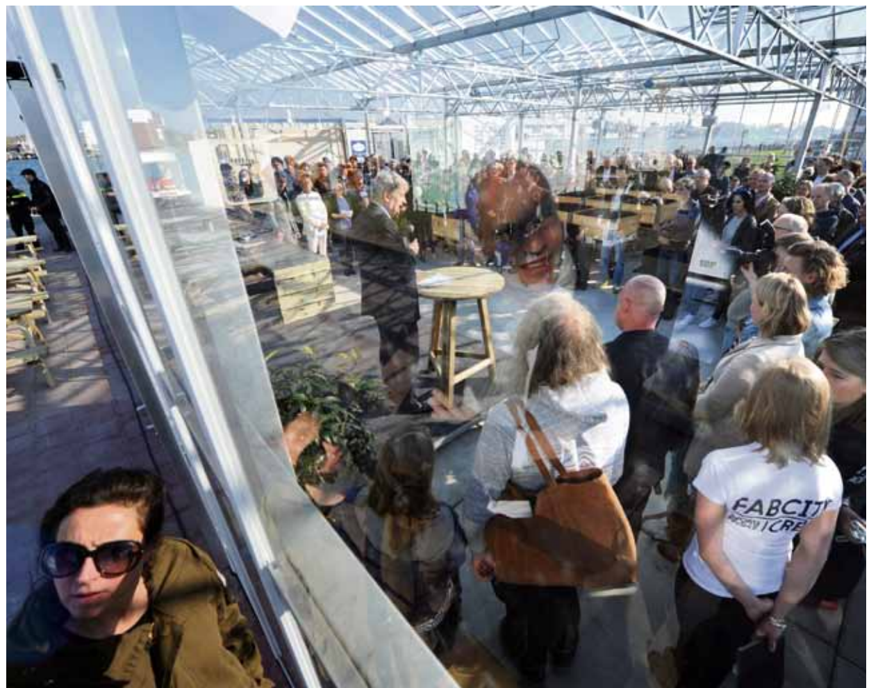
De opening van FabCity. Burgemeester Eberhard van der Laan was er voor de gelegenheid, samen met minister van VWS Jet Bussemaker, ereburger.