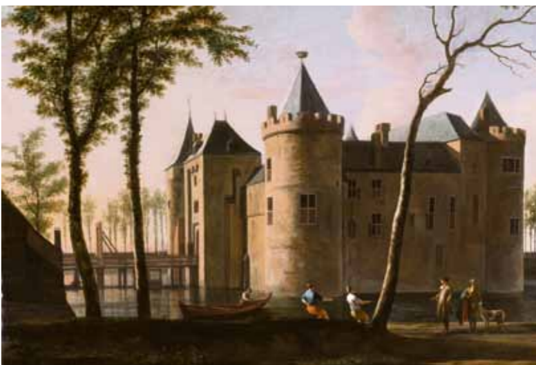
Het schilderij van Berckheyde uit de 17e eeuw.

Het Muiderslot heeft de hand weten te leggen op een 17de-eeuws schilderij van het kasteel, geschilderd door Gerrit Berckheyde. Het kasteel prijst zich gelukkig met de aanwezigheid, want wereldwijd zijn er uit die periode maar zes schilderijen van Haarlem en Amsterdam en maakte ook het beroemde schilderij Gezicht op de Gouden Bocht, dat deel uitmaakt van de collectie van het Rijksmuseum. Het Muiderslot deed de bijzondere aankoop op de internationale kunstbeurs TEFAF, mede dankzij de steun van de Vriendenvereniging Muiderslot en de businessclub Amicorum. "Het