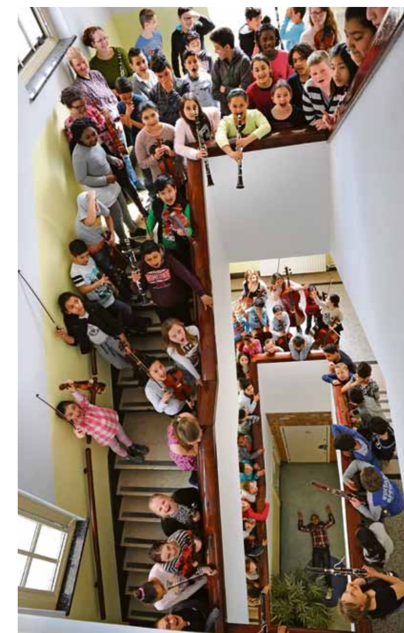
Het Leerorkest in De Valentijnschool, Indische buurt. "Mijn leerlingen zijn echt goed."

Gelukkig is er voor talenten vanaf september het nieuw opgerichte Amsterdam Youth Philharmonic, waarin middelbare scholieren hun tanden in echte symfonieën zullen zetten. Waar dat orkest gaat repeteren? U raadt het al: in de Majellakerk, het onderkomen van het grootste orkest van de Indische Buurt: het Nederlands Philharmonisch Orkest.