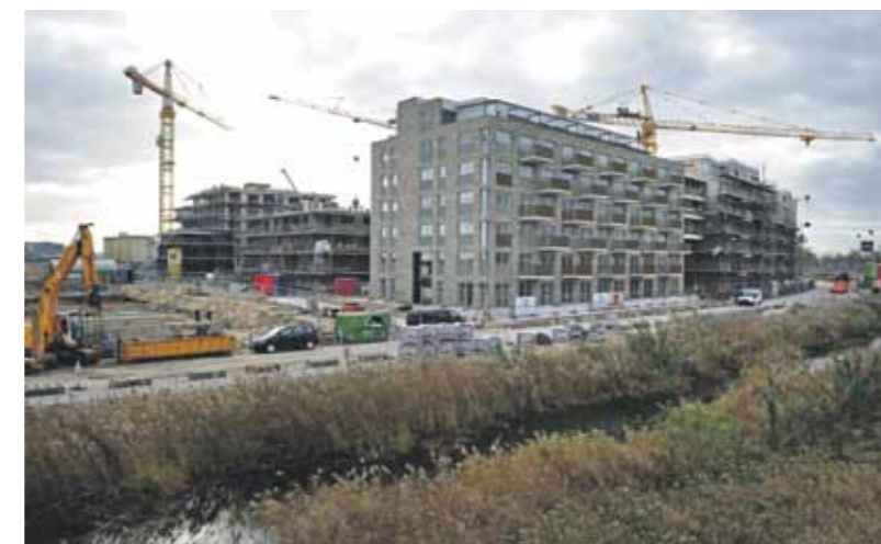
In een jaar tijd is er veel gebouwd op Zeeburgereiland.

Zij mochten niet alleen meepraten over dingen in hun woning zoals kleur en tegels van de badkamer, maar ook over de openbare ruimte. Een van de drie oorspronkelijk geplande sportvelden in de wijk werd zo een buurtpark, met skatebaan en slingerpaden. “Dat is, dankzij inspraak, een enorme verbetering van het oorspronkelijke plan.”