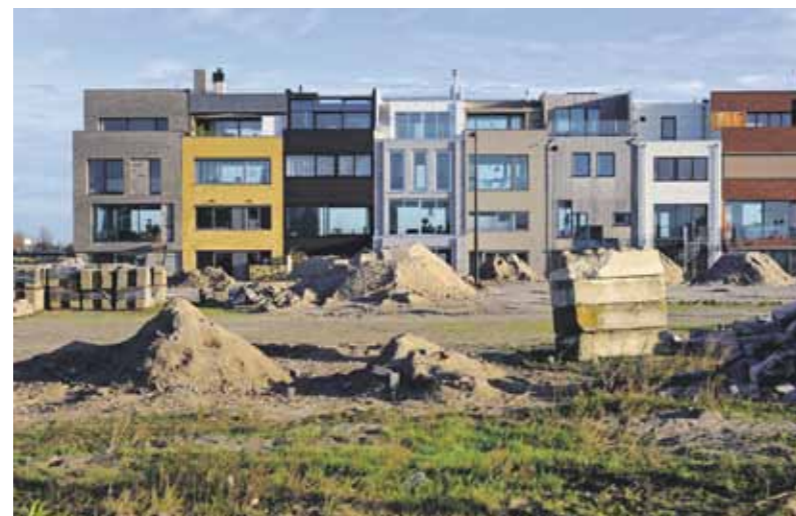
Zelfbouwhuizen aan de Kea Boumanstraat

Welstandstoezicht is voor iedereen juist een voordeel: 1. Particulieren die zonder architect willen bouwen, worden tegen zichzelf beschermd. 2. Mensen die wel een architect hebben ingescha-