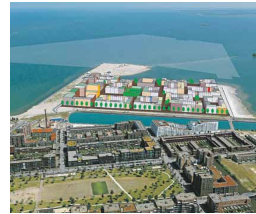
Centumeiland in vogelvlucht, zoals afgebeeld in het concept Stedenbouwkundig Plan Centumeiland.

Ruim honderd belangstellenden luisterden naar het hoe