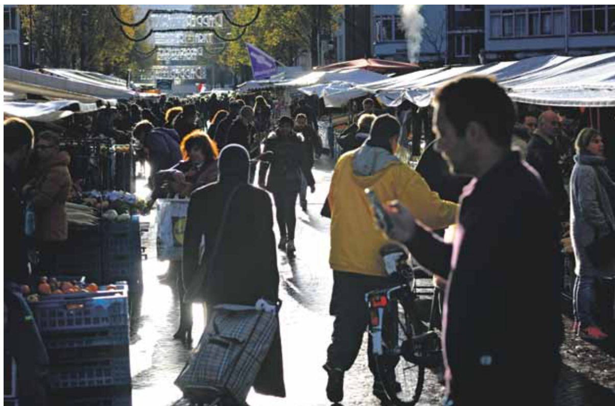
De Dappermarkt, een smeltkroes van culturen en nationaliteiten.

Hier in Amsterdam-Oost zijn wijken – de Indische, Transvaal- en Dapperbuurt – waar grote immigrantengemeenschappen wonen in vaak (nog) slechte sociale woningbouw. Waar de werkloosheid- en criminaliteitscijfers hoger zijn dan gemiddeld in de stad, en zeker hoger dan gemiddeld in Nederland. Waar, ondanks de verbeteringen en investeringen, bij tijd en wijle geronseld wordt voor de strijd in Syrië. De buurt "ten ninety five, waar je met AK's gepopt kan worden", zoals een buurtbewoner na een schietpartij vlak bij de Praxis zei tegen AT5.