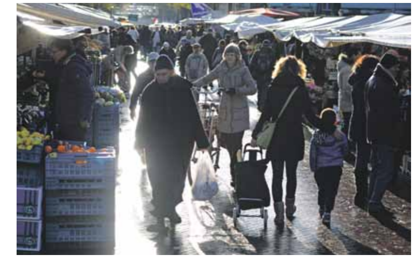
De Dappermarkt.

Maar het beleid gaat ten koste van de informatievoorziening. Door het sluiten van bureaus creëer je meer afstand tussen burger en politie, zegt criminoloog Jasper van der Kemp,