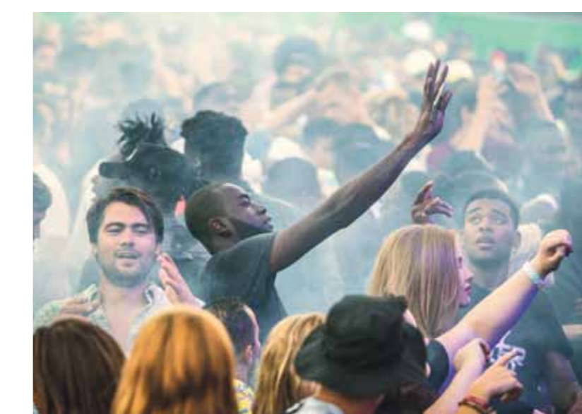
Appelsap in het Flevopark, augustus 2015.

Het hiphopfestival Appelsap zal waarschijnlijk opnieuw in het Flevopark worden gehouden. Waar de andere evenementen komen, moet nog blijken. Het stadsdeel wil spreiden, maar