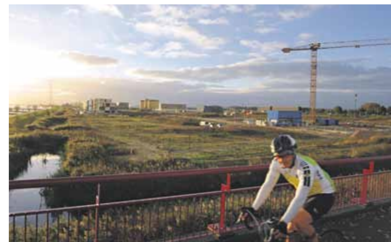
Zomer 2014 was het nog rustig op Zeeburgereiland.

Maar van meet af aan toekomstige bewoners betrekken bij de ontwikkeling van de wijk, hoe doe je dat? Top: “We plaatsten een oproep op facebook: ‘Pio-