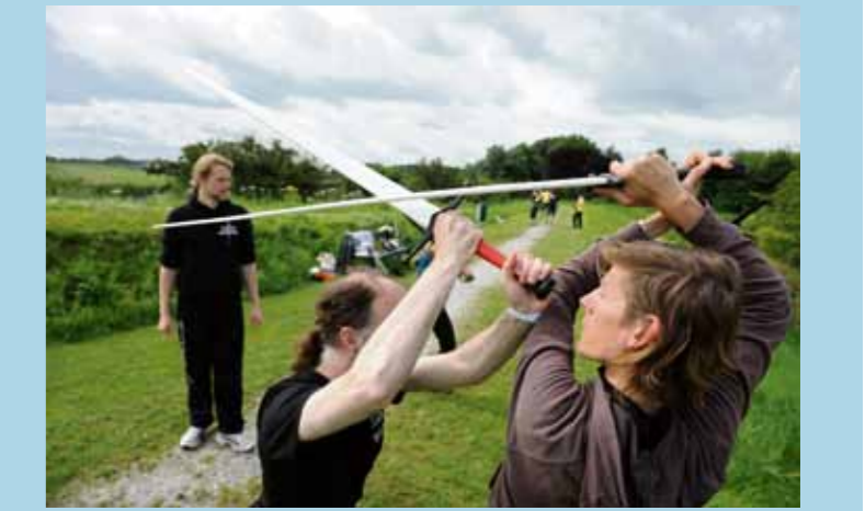
Zwaardvechtsport Muiderslot.

Tijdens de pinksterdagen op 24 en 25 mei komen in het Muiderslot de middeleeuwen tot leven met ridders en jonkvrouwen van krijgskunstschool Zwaard & Steen. Er zijn zwaardvechtlessen, wapendemonstraties en kiddie battles, waarin de kinderen de strijd aan mogen gaan met geharnaste ridders. In de pruimenboomgaard achter het kasteel komt een middeleeuws kampement. In de tenten maken bezoekers kennis met het dagelijks leven van die tijd. Zij kunnen deelnemen aan allerlei activiteiten, waaronder het maken van een eigen maliënkolder, middeleeuwse bordspellen en broodjes bakken boven het vuur. Kinderen ontvangen bij toegang tot het slot een speurtocht, een echte ridderqueeste. Info op muiderslot.nl .