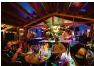
Café-restaurant Camping Zeeburg.

Camping Zeeburg zet op zaterdag 13 en zondag 14 juni de deuren open voor buitenlucht én burens. Amsterdamers kunnen gratis komen kamperen en genieten van de bijzondere sfeer. Op beide dagen is er livemuziek. Ook