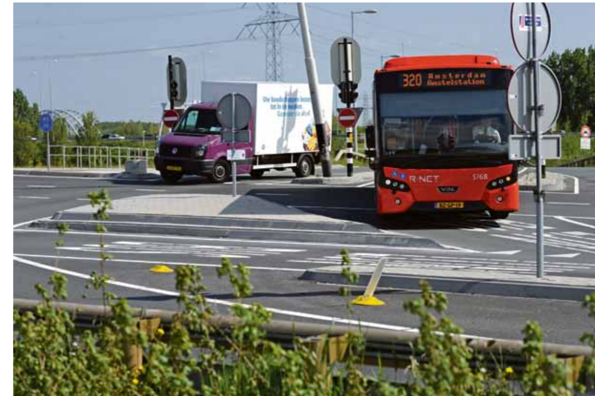
De plek des onheils.

De gemeente Diemen heeft onlangs draconische maatregelen genomen om het IJburgers onmogelijk te maken via een 'circustruc' de kortste weg naar de Maxis te nemen. Door de aanleg van een hoge vluchtheuvel bij de afslag Fortdiemerdamweg is het niet meer mogelijk de parallelweg over de Muiderbrug op te draaien.