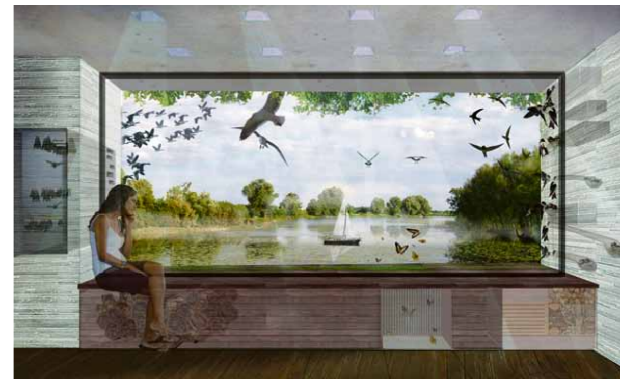
BEELD DS EN VENHOEVENS

Op dit moment leeft de helft van de bevolking in steden, in 2050 is dat driekwart. Een evenwichtig ecosysteem vergroot de leefbaarheid van de stad. Lehner: “Om niet de Aziatische steden achterna te gaan, waar de leefbaarheid laag is, moeten we natuur meer plaats geven. Door bepaalde soorten vogels in de stad nestgelegenheid te bieden, kunnen plagen worden voorko-