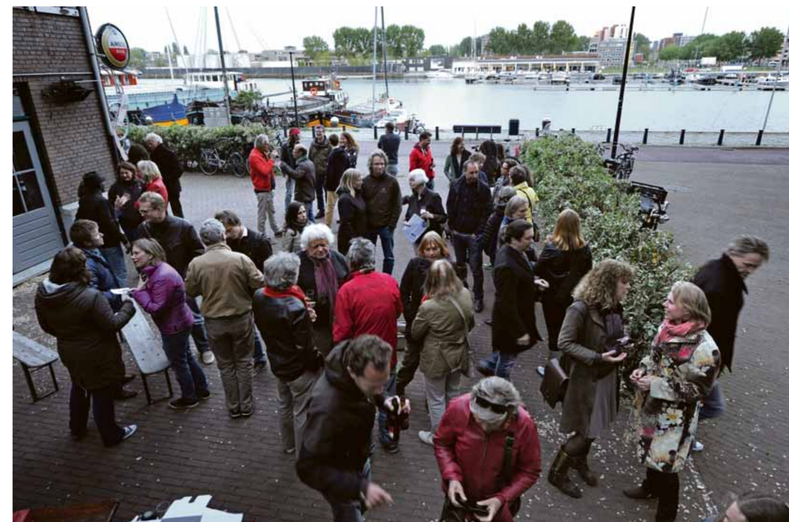
Buurtborrel bij De Oceaan, het gebouw van het oude havenkantoor op Borneo-eiland dat al drie jaar leeg staat.

De Oceaan kent een rijke geschiedenis van leegstand, schulden en faillissement. Tien jaar diende het als horeca-etablisement, van Italiaans restaurant tot pizzeria. Tot begin 2012 de laatste gebruiker het pand overladen met schulden achterliet. Vervolgens heeft de curator het hele interieur tot aan de elektriciteitsdraden toe laten strippen. En dat terwijl het gebouw vóór die tijd diende als werkplaats van de beroemde provo en kunstenaar Robert Jasper Grootveld, die als anti-rookmagiër ‘happenings’ organiseerde bij het Lieverdij