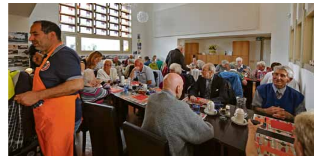
Eten in Het Brinkhuis. "Een vaste plek heb je alleen op het kerkhof."

Dat het buurtrestaurant goed loopt, komt mede door de participatiemedewerkers