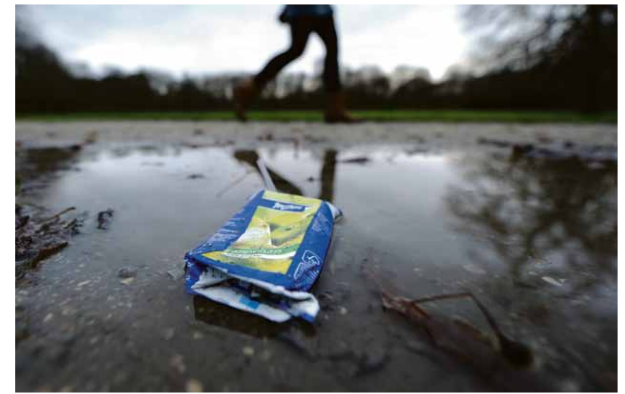
Appelsap in het Flevopark, de 'Vrienden van' zijn tegen.

Ecologische Hoofdstructuur Weer het argument van rust, dat ook al zo vaak in de discussie rondom het Oosterpark is aangevoerd. Maar bij de verplaatsing naar het Flevopark is er meer aan de hand. Want anders