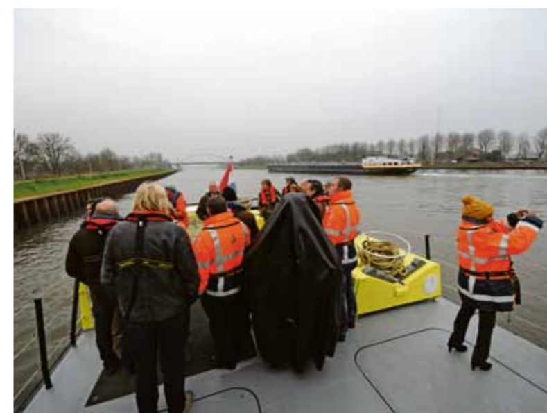
Het Amsterdam-Rijnkanaal is nu bijna overal 100 meter breed. Alleen ten noorden van de Amsterdamsebrug zit nog een of bottleneck. Daar is het kanaal 65 meter breed.

Rijkswaterstaat heeft het sluiseiland Zeeburg verwijderd uit het Amsterdam-Rijnkanaal (ARK). Het eilandje maakte onderdeel uit van een sluisenstelsel dat vroeger bescherming bood bij hoogwater. Andere delen van het complex waren al eerder verwijderd. Het ARK is een drukke vaarroute, en het eilandje vormde steeds meer een knelpunt voor de scheepvaart. Door de ingreep is de vaarweg verbreed van 50 naar 100 meter, wat de doorstroming en de veiligheid sterk verbeterd heeft. In de bocht van het ARK, ten zuiden van het voormalige sluiseiland, wordt komend jaar een natuurvriendelijke oever aangelegd. Deze zal bestaan uit een vooroever met een luwe zone daarachter, waar diverse soorten flora en fauna zich kunnen ontwikkelen.