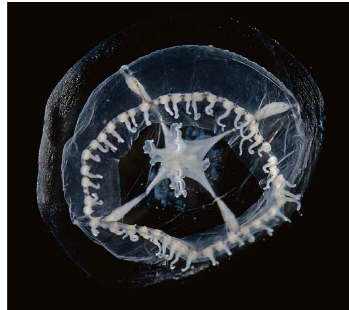
Melchers ontdekte veel soorten en biologische feitjes voor Amsterdam, maar deed met het 'frankjerokje' voor het eerst een Nederlandse ontdekking. "Dit kwalletje lijkt wel een ruimteschip."

Toen het dier in 2013 voor het eerst werd gevangen en nog niet gedetermineerd was, kreeg Melchers van een kwalkenner te horen dat hij op moest passen met het beest. Het dier had namelijk wel iets weg van de dodelijke Australische zee-wesp. Dat is een tropische kwalensoort die voor zover bekend alleen voor de kust van Austr-