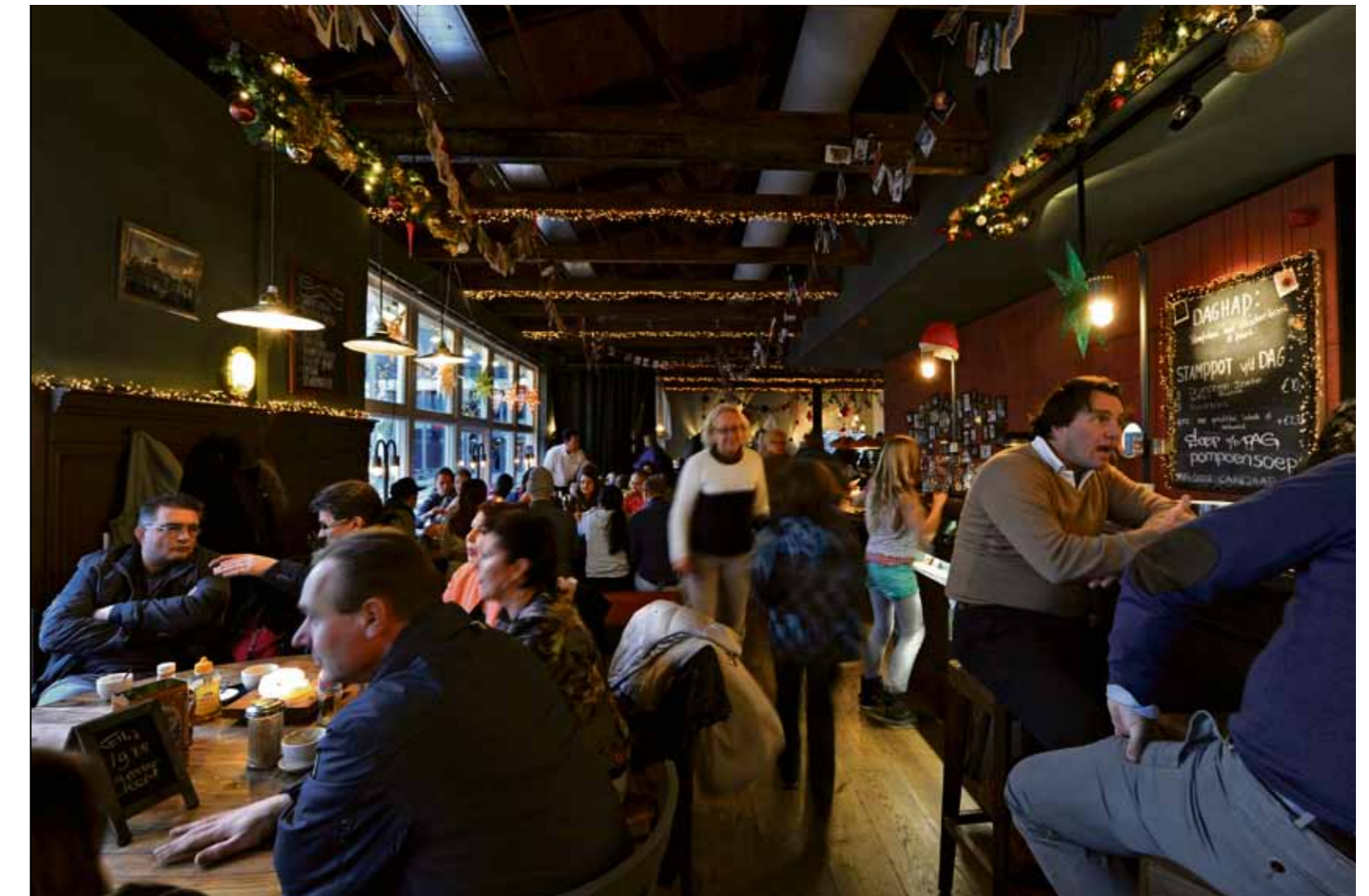
Café JAAP bij de Jaap Eden Edenbaan is open. Een gast: “Dat oude makkers-gevoel is weg. Alle generaties lopen nu door elkaar heen.”

Het café kent een roerige geschiedenis. De directie van de schaatsbaan besloot een paar jaar geleden de exploitatie van het café in eigen beheer