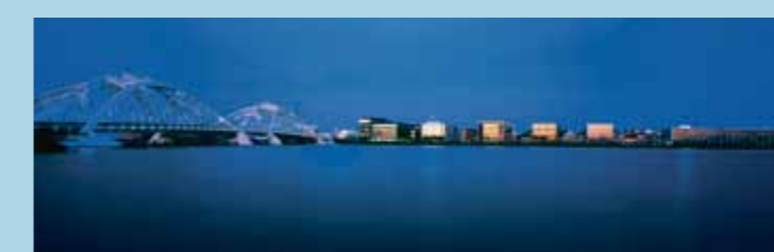
Design Strip.

Om dit mogelijk te maken is Spiazzo bezig met crowdfunding, in samenwerking met Symbid. Op dit moment staat de teller op €32.100, dat is 54% van wat nodig is. Als tegenprestatie ontvangen investeerders 20 procent van de aandelen. Investeren kan vanaf €20. Zie https://www.symbid.nl/ideas/6361-realisatie-van-spiazzo-bv