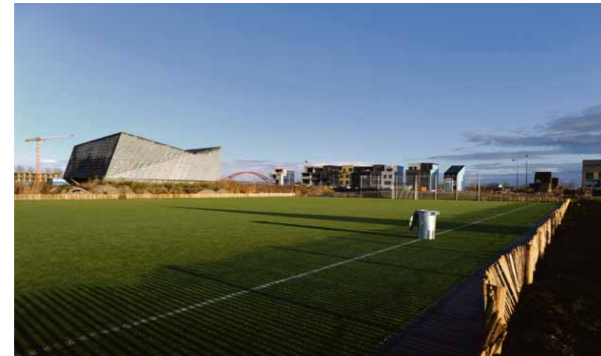
Het boostergemaal op Zeeburgereiland zorgt ervoor dat het rioolwater uit Oost naar de waterzuivering (Westelijk Havengebied) wordt gepompt.