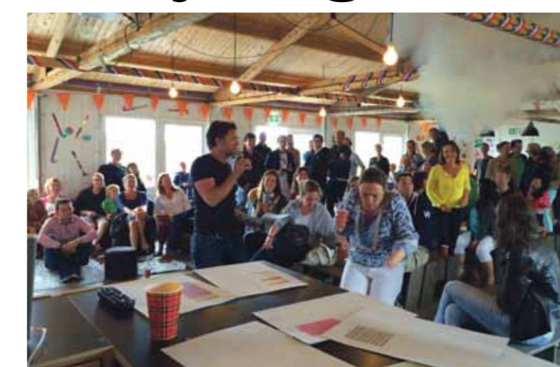
Witte rook in het clubhuis van AHC IJburg.

Tijdens de witte rook-sessies gaan alle teams bij elkaar zitten om de rollen onderling te verdelen. Op een formulier wordt aangegeven welke speler of ouder welke taak gaat vervullen. Als alle rollen zijn ingevuld wordt het formulier