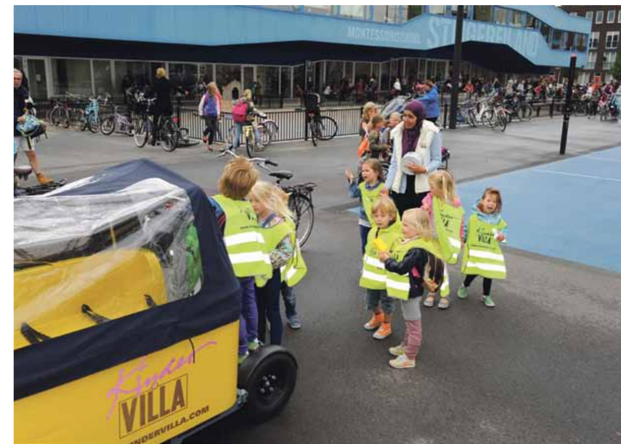
KinderVilla-kinderen gaan optimaal voorbereid naar school.

Basisscholen zijn positief over kinderen die van KinderVilla komen. De kleuters voelen zich veiliger in de groep, zijn leergierig, sociaal, zelfredzaam en behulpzaam. Ze lopen bovendien voor in hun woordenschat en rekenvaardigheden. Ze zitten letterlijk en figuurlijk 'beter in hun vel'. Wat doet KinderVilla anders dan andere kinderdagverblijven?