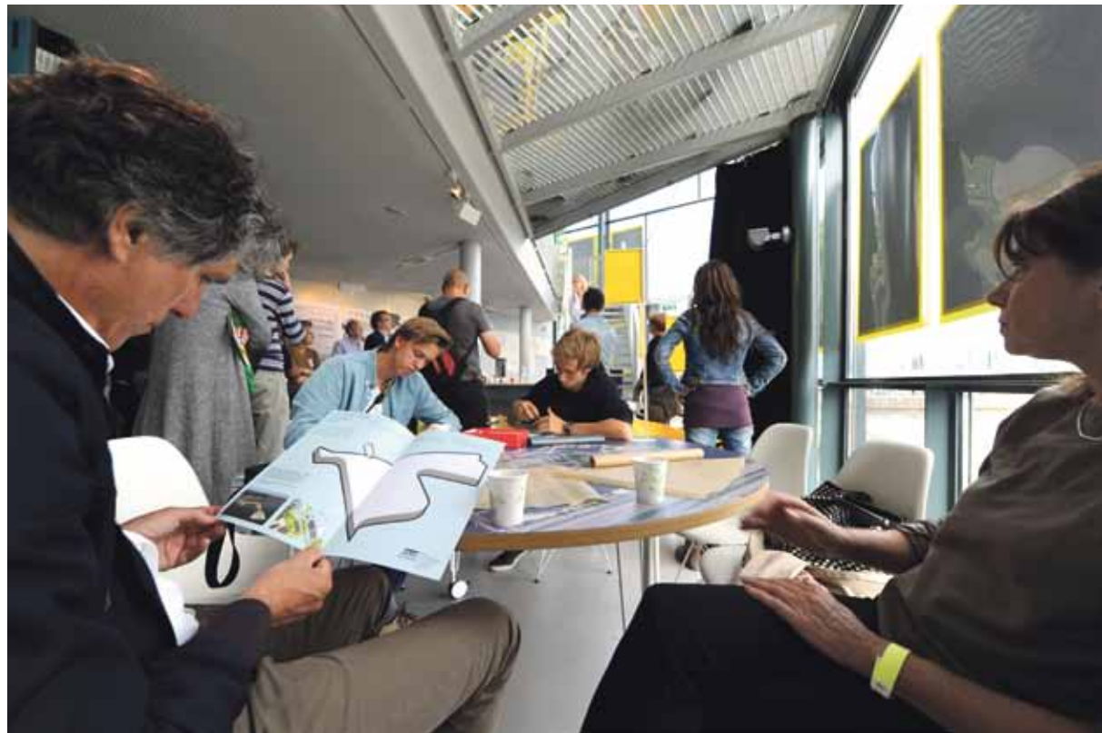
Opening van de expositie Land in Zicht bij Arcam aan de Prins Hendrikkade. De ingediende ideeën voor Centrumeiland zijn daar de komende tijd te bezichtigen.

Deze eerste oogst is het voorlopige resultaat van de creativiteit waarmee tal van Amsterdammers – IJburgers, scholieren, ondernemers, hele gezinnen – en andere geïnteresseerden gehoor gaven aan de oproep om te vertellen hoe zij dat nieuwe land voor zich zien. Centrumeiland is voorlopig het enige onderdeel van IJburg fase 2 dat wordt gerealiseerd. Begin 2015 is het landmaken klaar. Strand Blijburg verhuist dan naar de uiterste oostpunt van het nieuwe eiland, en daar