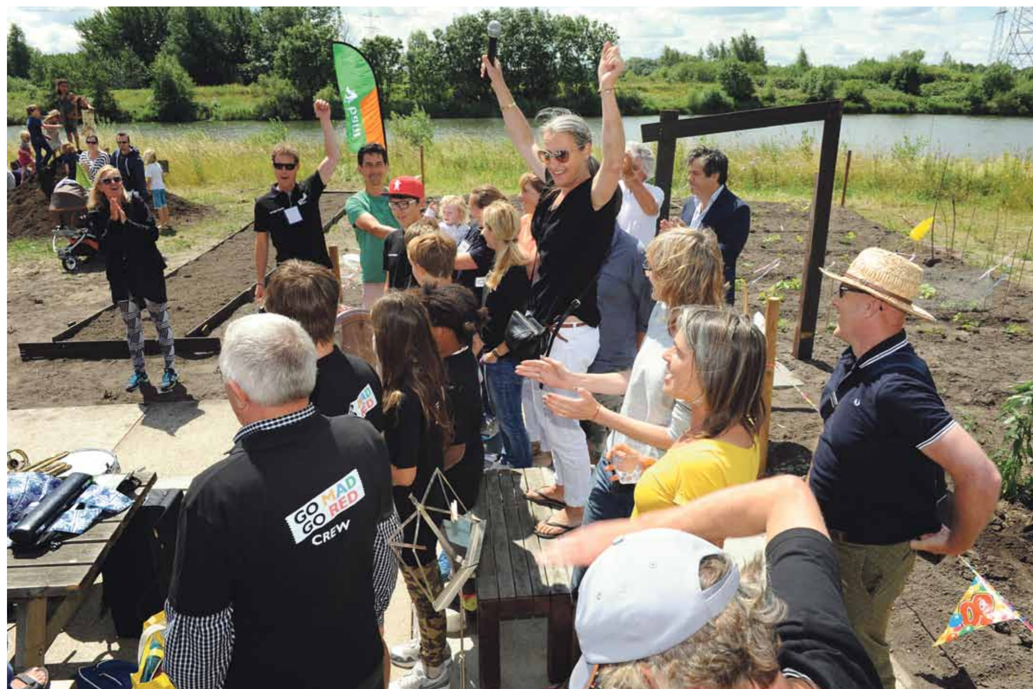
Een applaus voor de vele vrijwilligers tijdens de officiële opening van De Boerderij op 22 juni. Ze maken er een plek van voor sport en spel in de natuur.

Zondag 22 juni is op feestelijke wijze De Boerderij op IJburg geopend. Op Rietland Oost is een schuur verzeen die het middelpunt vormt van allerlei sport- en natuuractiviteiten, ponylessen en een moestuin. Ook werd deze middag de 'Verborgen dierenroute' langs de waterputten in het Diemerpark gelanceerd en het pilotproject van Ring-Ring afgesloten.