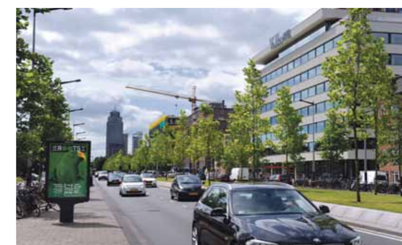
Aan de Wibautstraat, daar waar tot 2007 de redactie van De Volkskrant deadlines moest halen, is Het Volkshotel geopend.

Abeltje 2.0 leidt me naar de 7de verdieping. Zaklamp in de hand, want het licht werkt niet. Volkshotel is nog niet helemaal af. Dat betekent voor nu geen pin, geen sigarettenautomaat of bordje naar de wc. Deze triviale gemissen vergeet je snel als je binnenstapt en zowaar een déja vu ervaart... Tien jaar geleden, Club 11. Onvergetelijk. De gelijkenis is geen toeval, dezelfde interieurdesigner. De dames van de organisatie zijn blij: "Het is