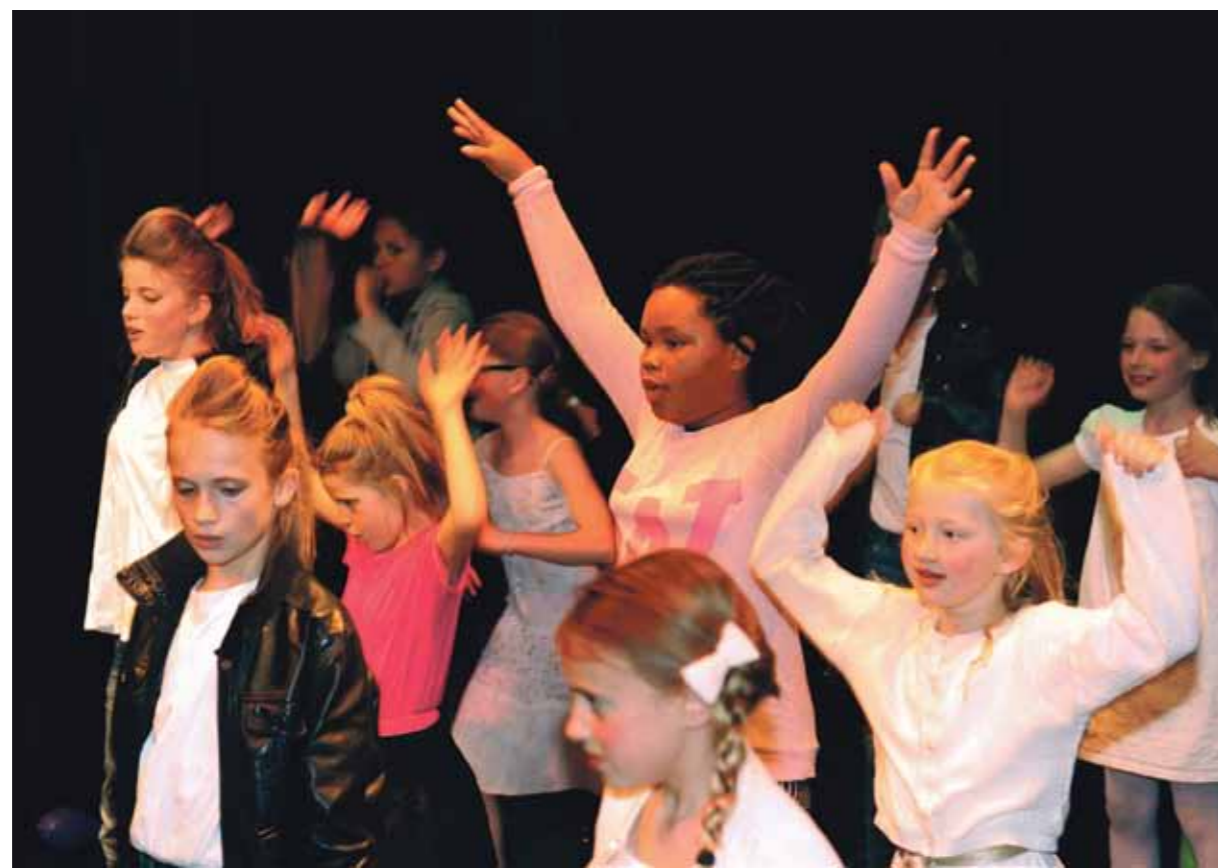
Slotstuk Grease van de musicalklas van Theatraal IJburg. De theaterschool breidt uit met drie dependances in Oost en Diemen.

Tien jaar geleden begon theaterdocente Thea Pruim met theaterlessen voor kinderen op IJburg. Ze was een van de eersten in Nederland die ook spelles gaf aan peuters en kleuters, toentertijd op tijdelijke locaties op IJburg. Ondertussen heeft TIJ een eigen kantoor en twee speelruimtes in het Centrum voor Vrije Tijd aan het Ed Pelsterpark en zijn er bijna dertig theaterdocenten aan de theaterschool verbonden. Daarbij beleeft het door Thea Pruim opgezette jeugdtheaterfestival Spektakel op IJburg in augustus alweer zijn tweede lustrum. De school is diepgeworteld in het