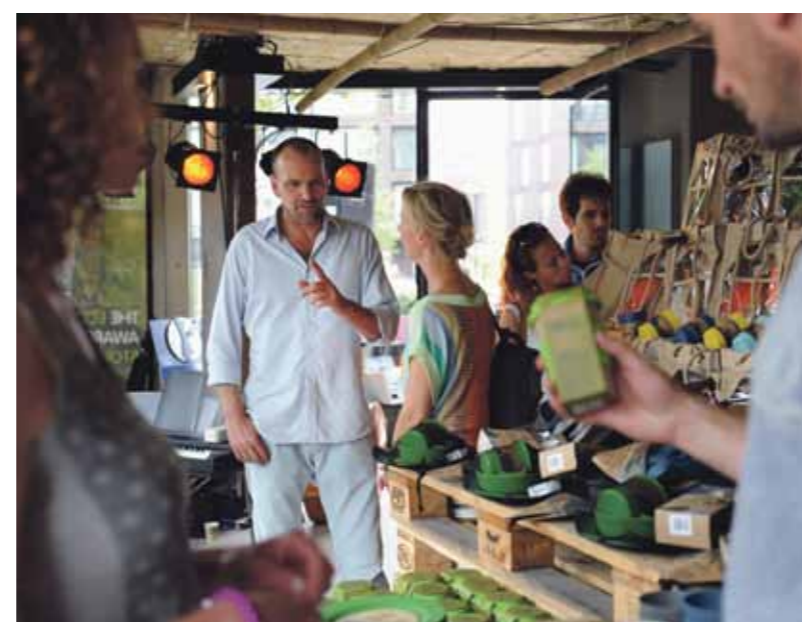
De flagstore aan de Pampuslaan.

Dankzij materialen van partners als Biological Solutions en Eco Soulife wordt het mogelijk concerten en festivals te organiseren die natuur en milieu minimaal belasten. Happy Panda richt zich met zijn missie ook op de politiek. De producten variëren van serviesgoed, diervoederbakken, bloempotten en bestek vervaardigd van plastic vervangende,