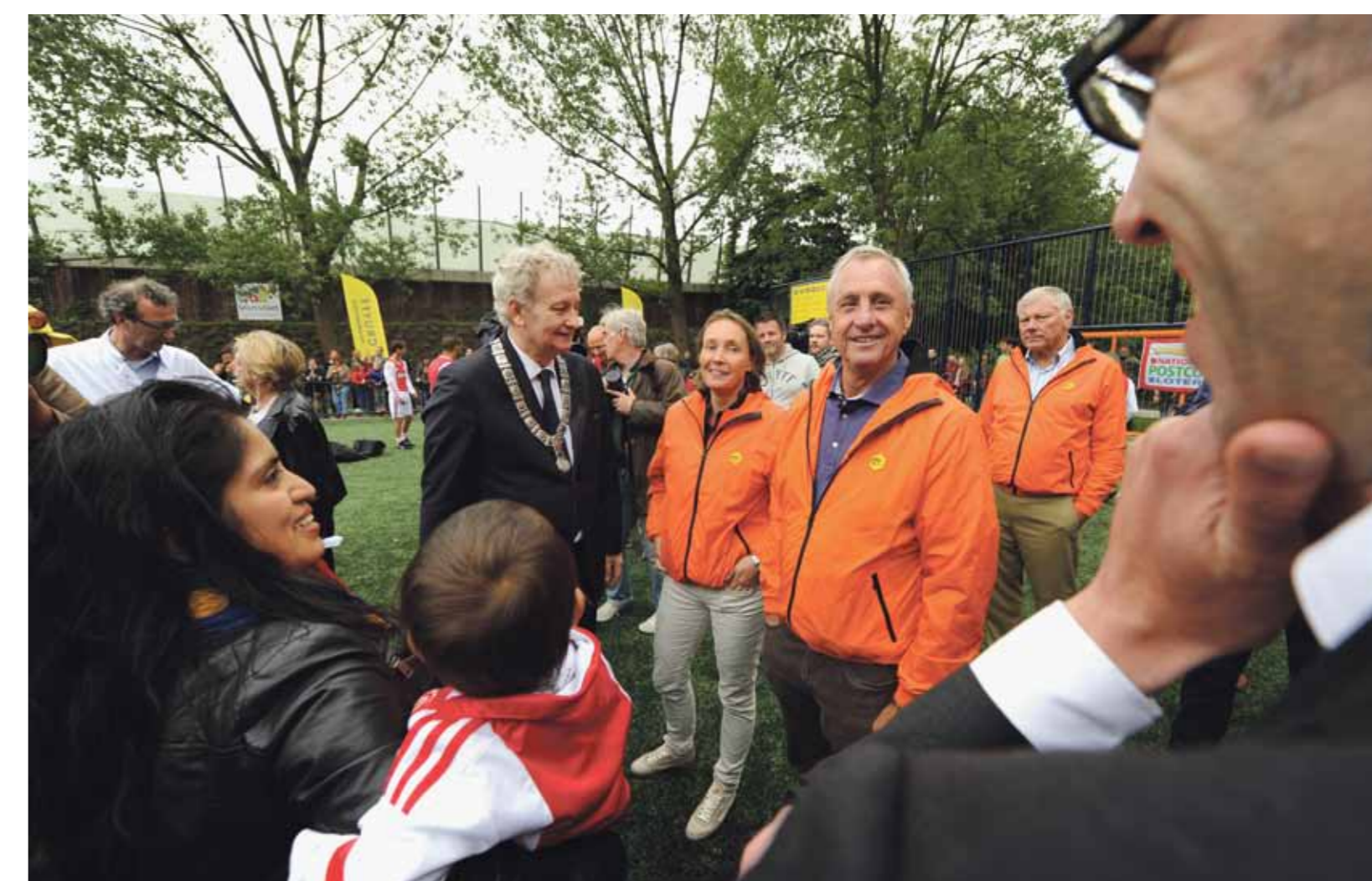
Het nieuwe Cruyff Court in Betondorp heeft niet alleen een kunstgras voetbalveld, maar ook een speeltuin, een basketbalveld en een outdoor fitness-studio. De plek werd onlangs geopend door Johan Cruijff zelf.