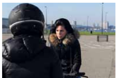
Jongeren op de Kop van Java-eiland.

WestCord Hotels mag een hotel bouwen op de kop van Java-eiland. De gemeente Amsterdam schreef in 2013 een tender uit voor de ontwikkeling van een uniek hotelconcept op deze plek. De inzendingen, vijf in