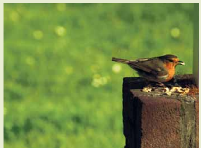
Het roodborstje, een veel voorkomende tuinvogel.

Hulp aan tuinvogels In veel tuinen wordt er voor de vogels 's winters wel een vetbol of pindanetje opgehangen. Toch kunnen ze – vooral in de stad – ook de rest van het jaar wat extra hulp goed gebruiken. Met een paar eenvoudige aanpassingen kun je jouw stadstuin(tje) zo inrichten dat vogels zich er thuis voelen. Hierbij zijn de vier v's van belang: voedsel, veiligheid (schuilplaatsen), voortplanting (nestplaatsen) en variatie. Wilt u graag meer vogels in de tuin zien (en horen!), neem dan contact op met Marga van der Schalie. Zie www.vogelbescherming.nl/ik_vogels_bij_u_in_de_buurt . Een advies kost €40 (leden van Vogelbescherming €25).