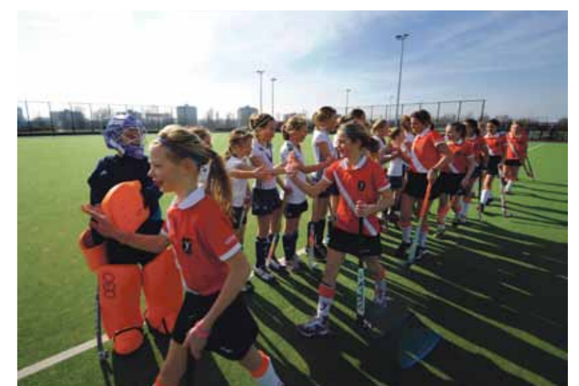
De DI van AHC IJburg schudt de handen van de tegenstander. De Shake Hands-campagne wordt door alle 42 Noord-Hollandse clubs gedragen.

AHC IJburg bestaat inmiddels bijna vier jaar en heeft 942 leden, 66 jeugdteams, Heren 1 in de derde klasse, een Dames 1-team, 58 Waterhoentjes en een actieve groep