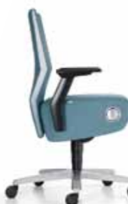
interstuhl Volume8 bureaustoel