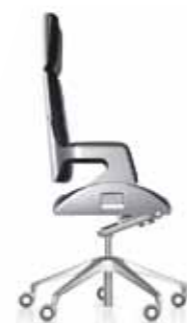
interstuhl Silver bureaustoel

nieuw in onze showroom: Interstuhl design collection