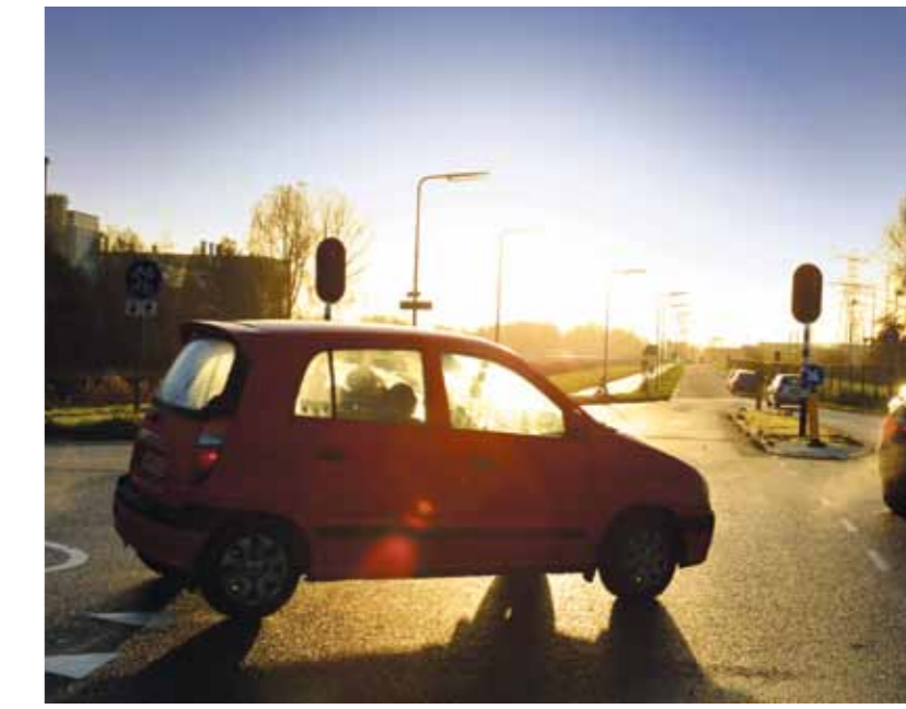
Rechtdoor de 'Nuonweg', officieel Overdiemerweg, die straks wordt afgesloten met een hek.

en Stadsregio Amsterdam moeten hun zegje doen – zijn we al gauw een paar maanden verder. En dan, zo bericht het uitvoerend projectbureau, gaan alle partijen om de tafel om de verschillende scenario's te bespreken. Vervolgens komt er een voorstel in de raad, moet er budget komen en moet er ook nog een bestemmingsplan worden gewijzigd. Dat neemt alles bij elkaar zoveel tijd in beslag dat het veel te duur zou zijn om de afronding van de OOIJ daarop te laten wachten.