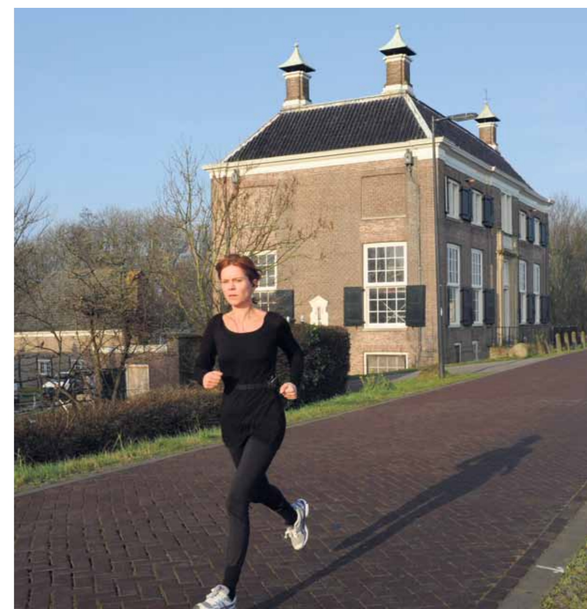
Gemeenlandshuis van Diemen aan de Diemerzeedijk. Een Rijksmonument. Begin april is de restauratie afgerond, dan is de ruimte te huur voor bijeenkomsten.

Wat omvang en indeling betreft is het Gemeenlandshuis vergelijkbaar met een 18de-eeuws buitenhuis. Het is een indrukwekkend, rechthoekig gebouw met op elke hoek van het schilddak een statige schoorsteen. De gevel is versierd met zogenoemde hoekklisenen en midden in de voorgevel prijkt een statige en-