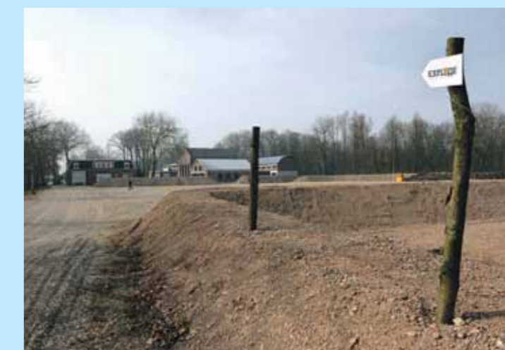
Het terrein van de voormalige kruitfabriek, waar de woningen verrijzen.