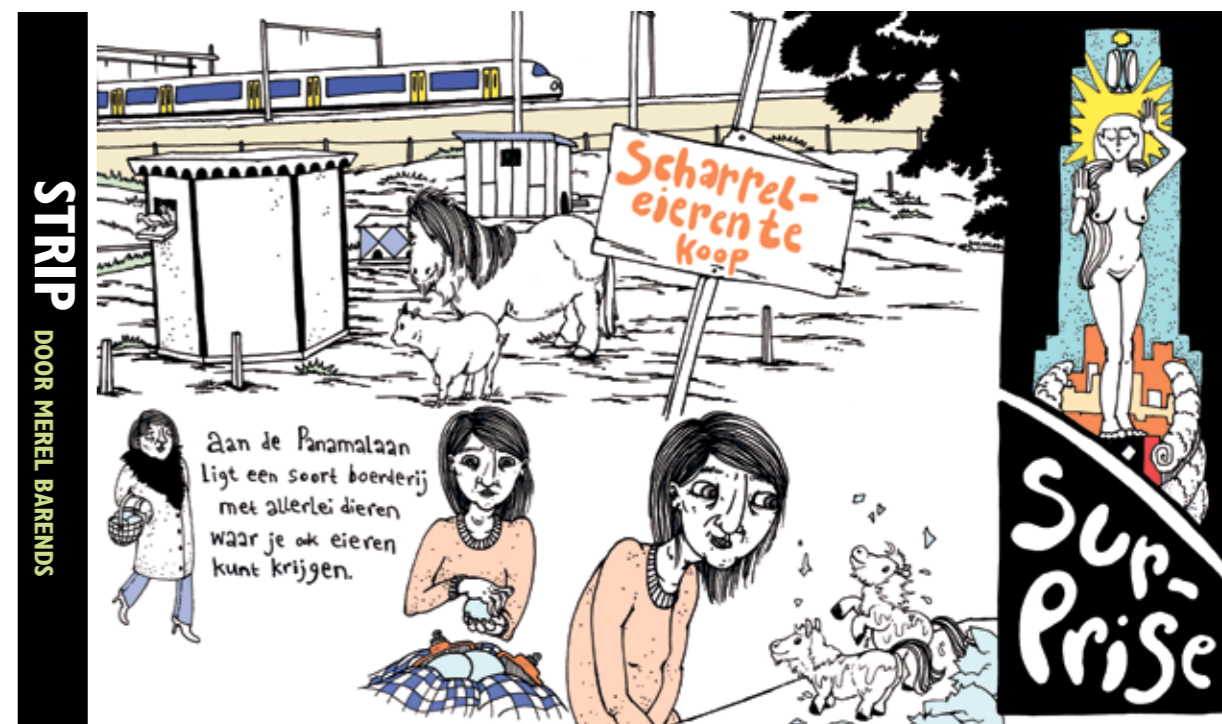
STRIP DOOR MEEL BARENDIS

Wil je ook de oude columns van Josine Marbus lezen of de columns van een van onze andere columnisten, check dan de website: www.debrugkrant.nl/columns