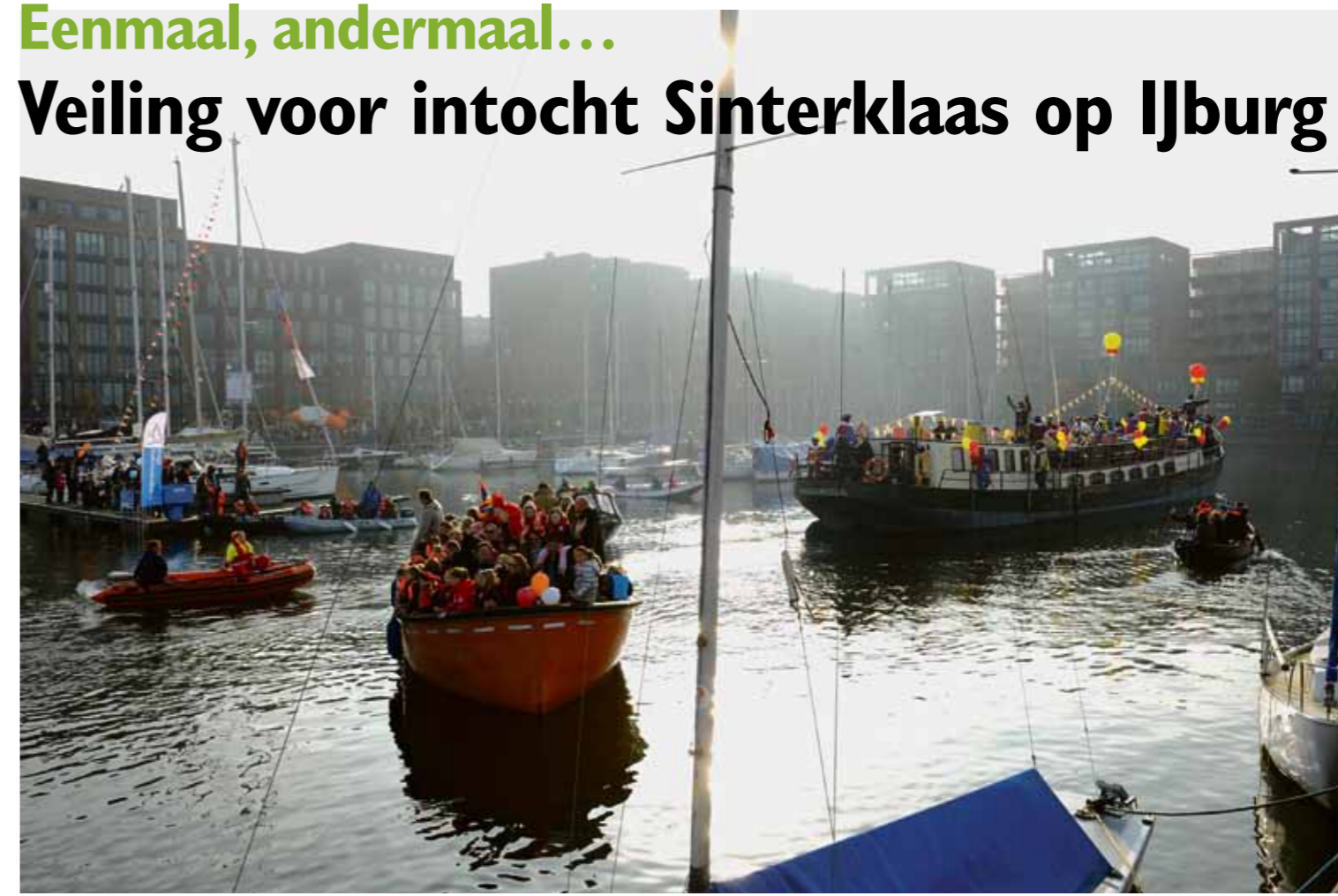
De intocht van Sint in de haven IJburg, 2011

Al twee jaar een mooie traditie: Sinterklaas vaart de haven van IJburg binnen, opgewacht door duizenden kinderen op de kade. Op 24 november aanstaande zou dit weer kunnen gebeuren. Maar dan is er – directer kunnen we het niet verwoorden – geld nodig. Met onder meer een online veiling wordt geprobeerd het benodigde bedrag bij elkaar te krijgen.