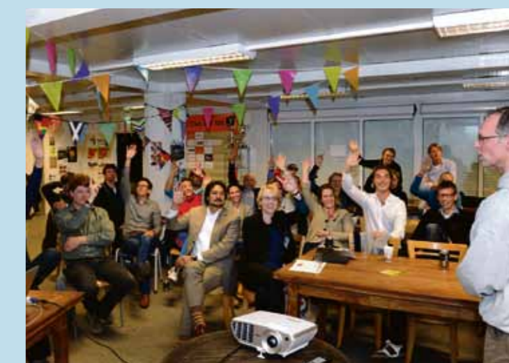
Stemmen voor een tijdelijk clubhuis tijdens de ALV AHC IJburg

Architect Jan van Erven Dorens heeft een schetsontwerp gepresenteerd voor een clubgebouw op ecologische grondslag. Het ontwerp, met werktitel 'De Plag', is tot stand gekomen in samenwerking met diverse specialisten op het gebied van ecologische technieken en installaties. Het dak van het gebouw is beplant met sedum, en rijst als een grasplag op uit het omliggende terrein. Hiermee voegt het gebouw zich op natuurlijke wijze in het park. De ontwikkeling van een definitief gebouw zal naar verwachting twee jaar in beslag nemen.