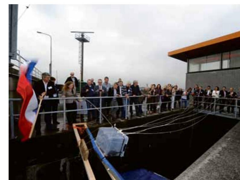
Opening van de speciale visdoorgang bij de Oranjesluizen

Trekvissen zoals de paling – die leven in zoet water maar zich voortplanten in zout water – dreigen uit te sterven. Door gemalen, dijken en sluisen kunnen zij niet meer vrijelijk naar de zee zwemmen en andersom. Bij de Oranjesluizen is nu een doorgang gecreëerd, zodat de vissen weer toegang hebben tot 'vis-snelweg' het Noordzeekanaal. De eerste in een reeks.