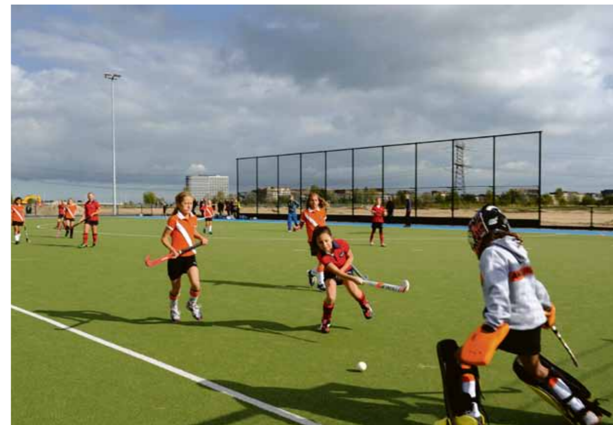
Sportpark IJburg in het Diemerpark

Er loopt een proef waarbij de garage onder winkelcentrum IJburg als mogelijke parkeerlocatie voor bezoekers van Sportpark IJburg wordt getest. Vijf andere parkeerplekopties werden al eerder in het herinrichtingsplan Diemerpark van stadsdeel Oost opgenomen. Niets staat nog vast.