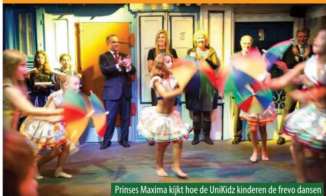
Prinses Maxima kijkt hoe de UniKidz kinderen de frevo dansen

Na weken oefenen tijdens de les 'Werelddansen' mochten de kinderen van BSO UniKidz optreden voor prinses Maxima in het Tropenmuseum in Amsterdam. Het optreden was een enorm succes, waarbij ook een aantal kinderen van BSO UniKidz geïnterviewd zijn door NOS en RTL.