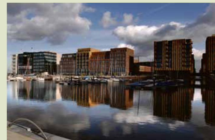
Haven IJburg

Op maandag 29 oktober is de eerste algemene ledenvergadering van ondernemersvereniging De Parel van Amsterdam. Op deze avond wordt er onder meer gesproken over gezamenlijke activiteiten in 2013 en de promotie van IJburg. De bijeenkomst is bedoeld voor alle ondernemers van IJburg (zowel leden als aspirant-leden, graag vooraf aanmelden op parelvanamsterdam@gmail.com ). Om 19.30 uur gaat de vergadering van start in café-restaurant DOK48 aan de Krijn Taconiskade.