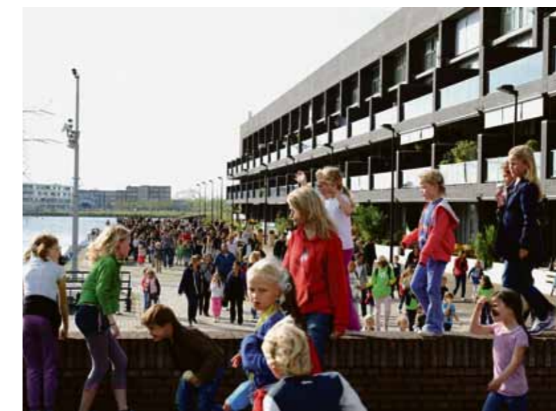
De blauwe Montessorischool, niet te missen

Onderwijsbond. Doel van de onderscheiding is om ook aan de werkgeverskant een impuls te geven aan de kwaliteit van het Nederlandse onderwijs.