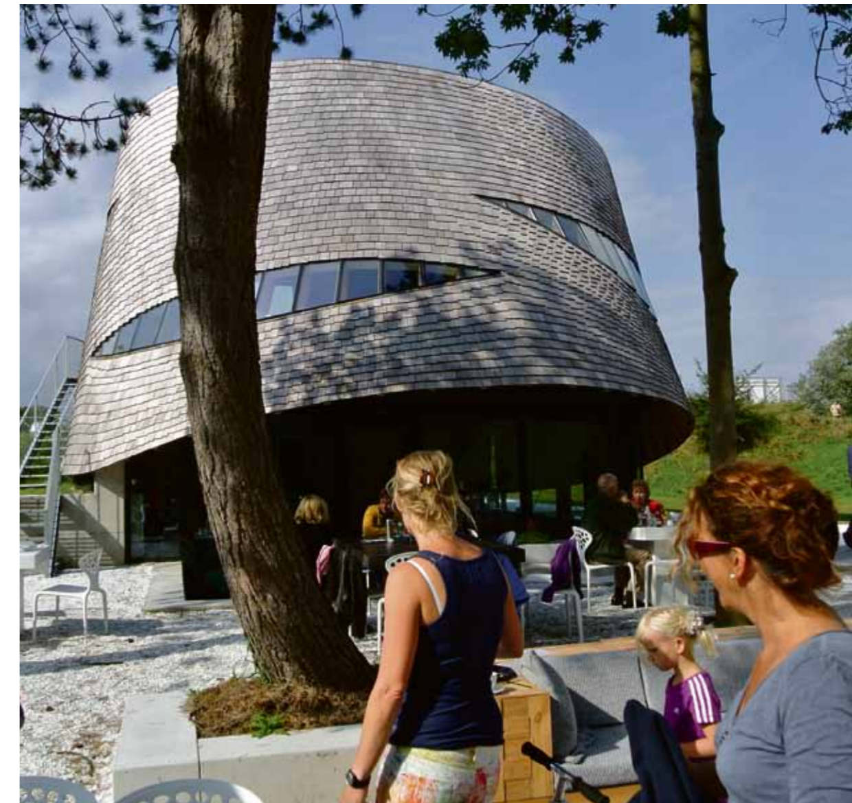
In 2012 werd bovenop Fort Diemerdam een modern horecapaviljoen geopend