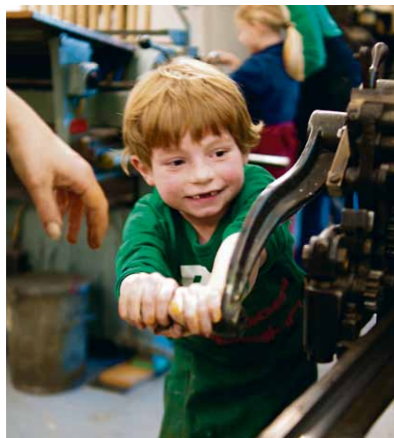
Draaien aan de pers

De pers kwam in handen van het GWA toen Molin hoorde dat deze bij de Hogeschool voor de Kunsten in Utrecht was vervoerd tot de schroot-voer – het lot van veel oude, logge grafische machines. De pers werd overgebracht naar de Molukkenstraat, waar in 2011 besloten werd tot een totale restauratie. Opdat hij weer echt gebruikt zou kunnen worden, door kunstenaars met oog voor het oude, en ook door kinderen die bij het GWA onderwijs krijgen in grafiek.