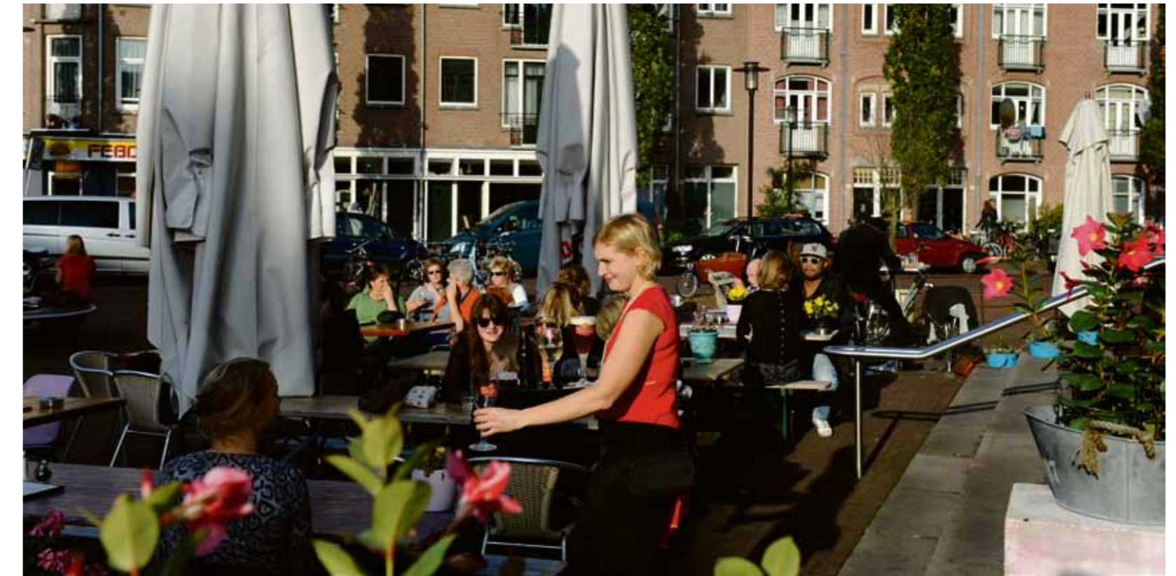
Het Badhuis-terras, Javaplein

Lust, geen last Horeca verhoogt de levendigheid van een buurt, daar is het merendeel van de bewoners van Oost het over eens. Tijdens de politieke avond die de deelraad begin 2012 organiseerde in TrouwAmsterdam werd de vraag gesteld of horeca een lust of een last is. Alle aanwezigen (op één na) beantwoordden de vraag met: "lust". Tegelijkertijd tonen recente voorbeelden ook de mindere kanten ervan. De Harbour Club en eerder Club Panama, twee publiekstrekkers in het Oostelijk Havengebied, bezorg(d)en door de geluids- overlast veel buurtbewoners letterlijk hoofdpijn. Club Pana-